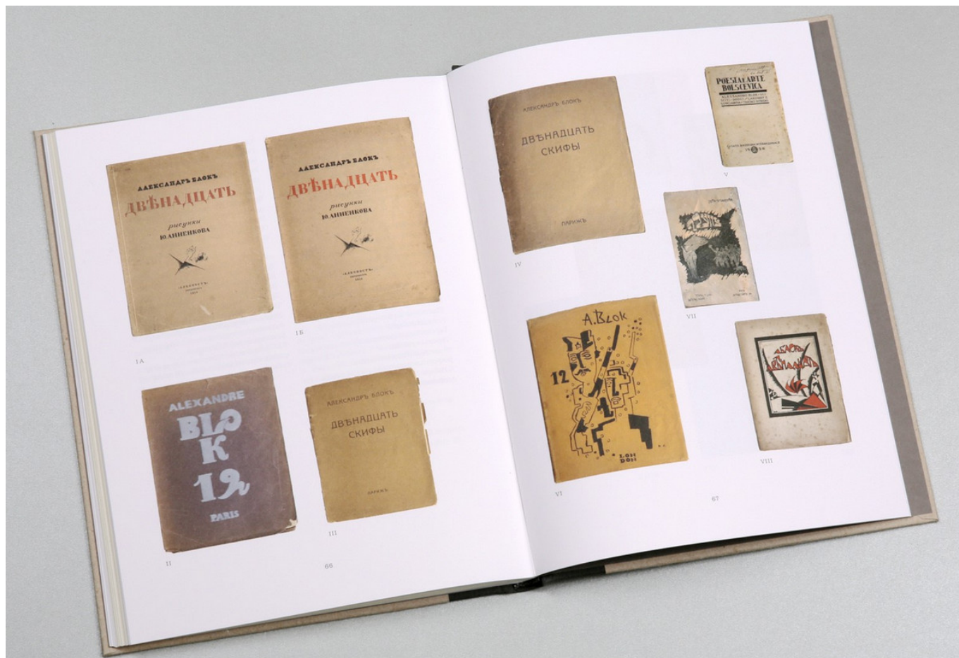
Обложки разных изданий "Двенадцати" на русском языке