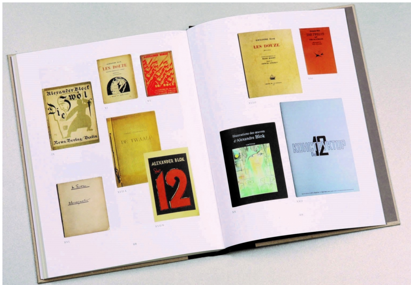
И на французском...

Начиная с 20-х годов обнаруживается одна из устойчивых — в будущем—черт «рецепции» Блока во Франции: интерес к Блоку христианских кругов, и в особенности левых христиан. В фокусе такого интереса — фигура Христа в финале «Двенадцати». Католический журнал «Фуа е ви» еще 16 декабря 1922 г. напечатал статью К. Мочульского под заглавием «Мастер современной русской поэзии — Александр Блок» («Foi et Vie », 1922, 16 декабря). Статья подводит итог творческому пути Блока, главная ее тема—блоковское видение России, родины грешной, но хранящей «искру веры». О «Двенадцати» Мочульский пишет: «Невозможно понять очень сложную композицию «Двенадцати» иначе, как в свете его (Блока) предыдущего поэтического творчества. Это поэма разрушения, песнь бешеного вихря, налетевшего на все социальные и политические ценности и разрушающего их. Вас захватывает головокружительное движение, опьяняет разнузданная и неукротимая свобода. Вспоминается „упоеание на краю бездны“, о котором говорил Пушкин».