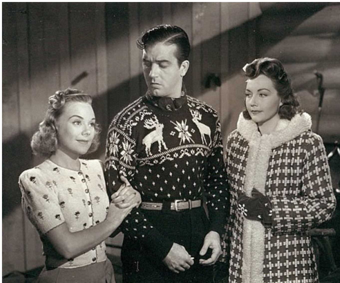
Кадр из фильма «Серенада солнечной долины»

Примечательно, что лыжный спорт в каком-то смысле содействовал и женской эмансипации. Сначала женщины катались на лыжах в юбках, но очень быстро сменили их на более удобные (и безопасные) брюки. Вскоре брюки пробрались из спортивного гардероба в повседневный.