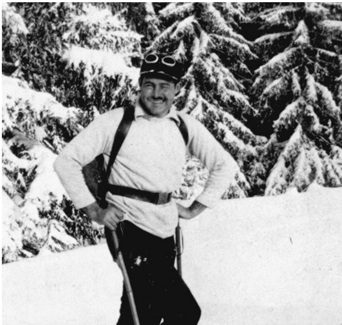
Эрнест Хемингуэй катался на лыжах в Гштаде в белом свитере

Хотя лыжи были известны человечеству давно, раньше они рассматривались только как удобное средство для передвижения по снегу. Ситуация изменилась после первых зимних Олимпийских игр в 1924 году, в программу которых были включены и лыжные гонки, и горнолыжный спорт. Популярность этих видов спорта выросла: аристократы, бонвиваны, промышленники, звезды кино, в общем, представители высших слоев общества устремились на альпийские курорты. За ними последовала и мода.