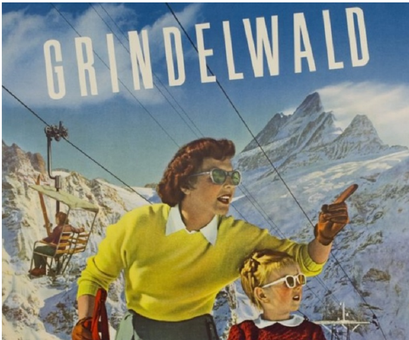
Лыжный свитер на винтажном плакате с рекламой Гриндельвальда

Современный гардероб трудно представить без такого необходимого предмета одежды, как свитер, но так было далеко не всегда.