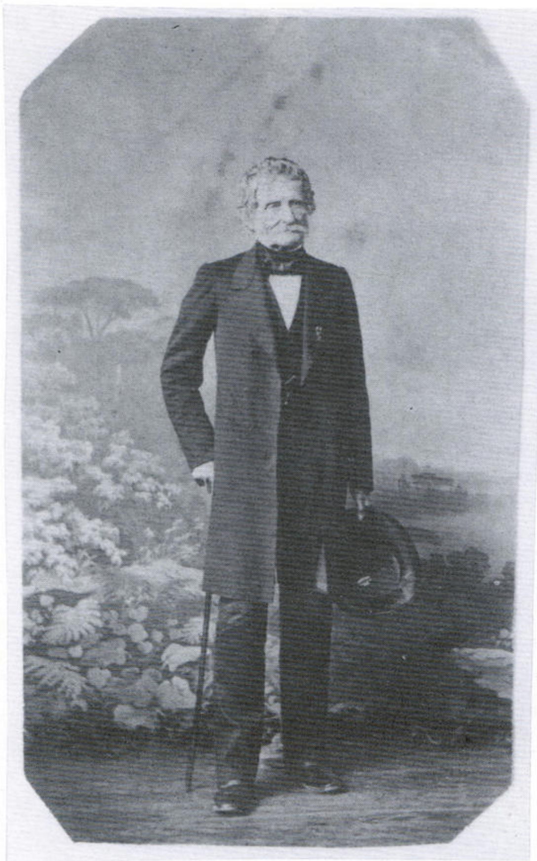
Генерал Жомини в конце жизни.

В Государственном архиве Фрибурга сохранились четыре письма генерала, адресованные герцогине-скульптору в период между 1864 и 1867 годами. Нигде о