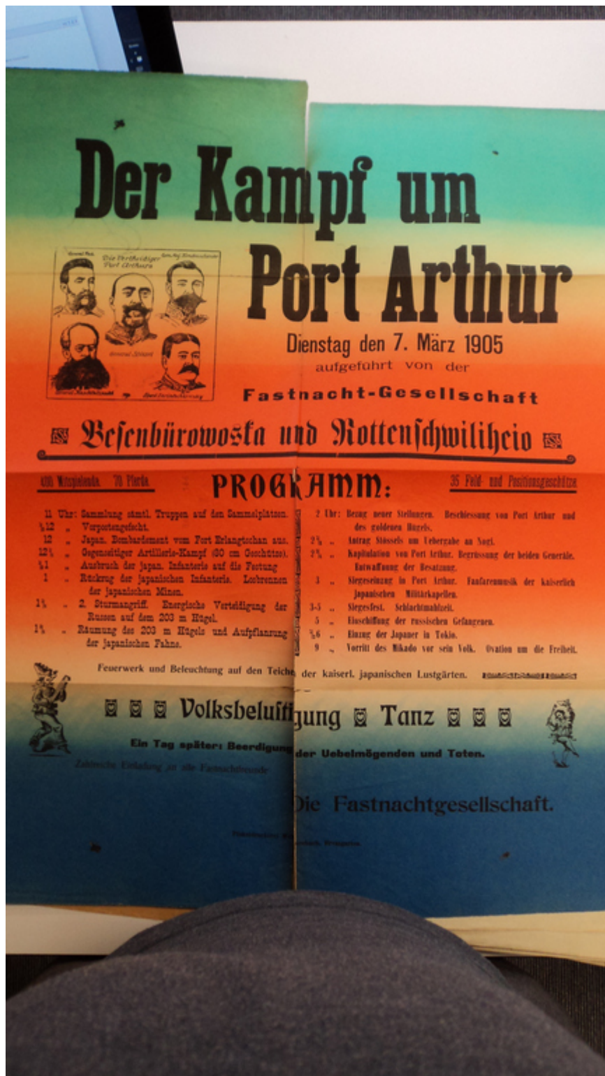
Афиша «масленичного гулянья» «Борьба за Порт-Артур» в Берне, 7 марта 1905 г.