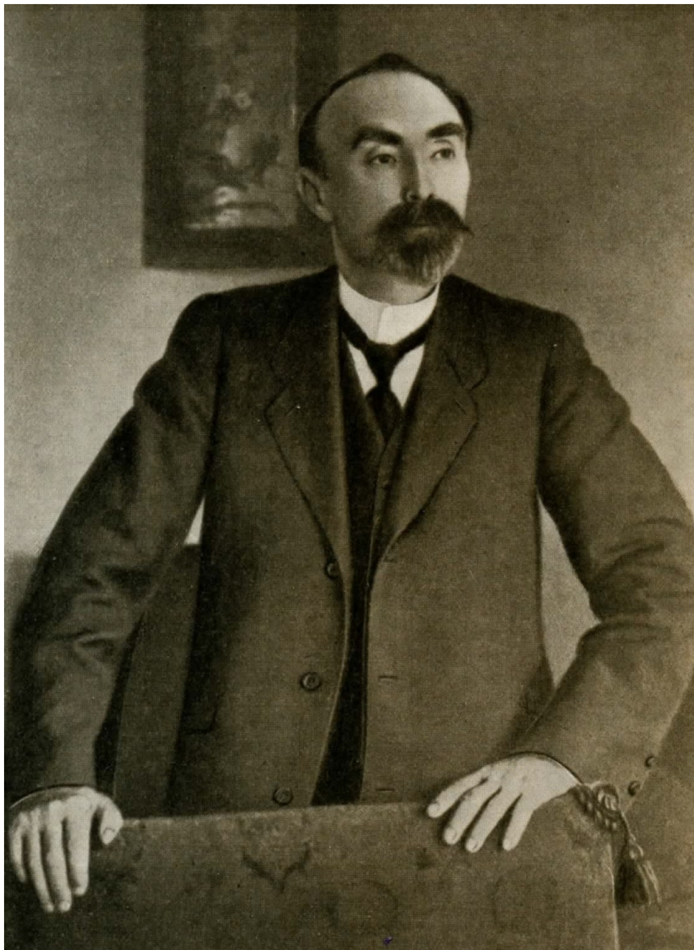
Г. В. Плеханов (1856-1918)

В обширном полицейском докладе от 30 ноября 1903 года перечислялись