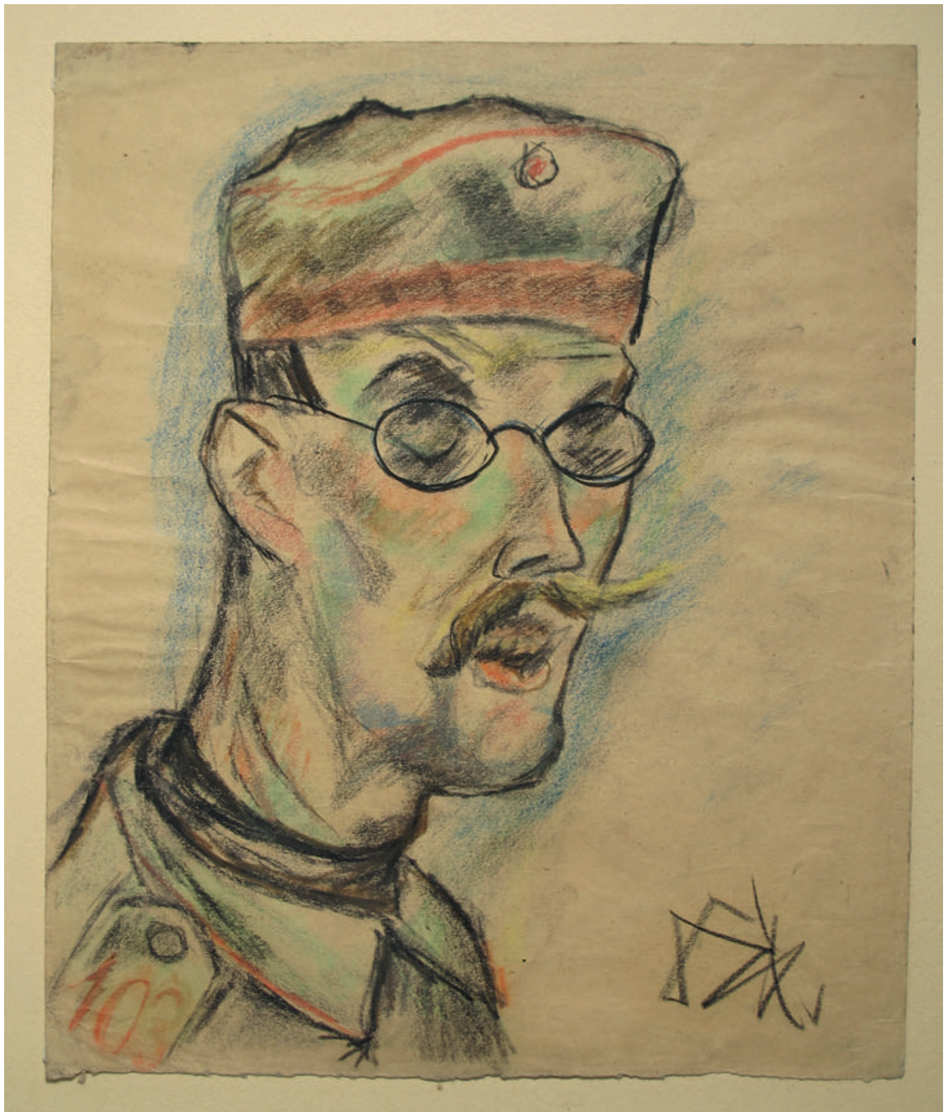
Солдат пехотного полка, Отто Дикс. Провенанс выясняется

Публичное реставрационное ателье нужно было не только для того, чтобы подогреть интерес публики к предстоящей выставке, но и чтобы показать, что музей – это намного больше, чем просто выставочное пространство. Это еще и исследовательский центр, в чьих лабораториях кипит научная работа.