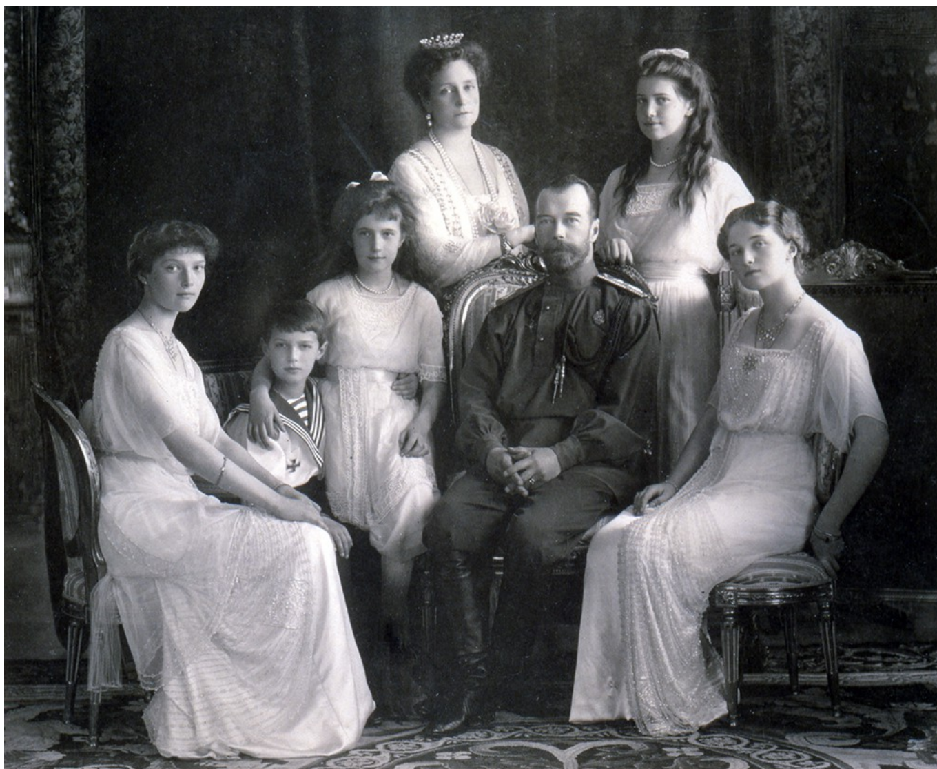
С Царской семьей Пьер Жильяр познакомился летом 1905 года в Петергофе

Осенью 1904 года Пьер Жильяр принял приглашение провести год в качестве преподавателя французского языка при детях герцога Георгия Лейхтенбергского, который проводил Лето 1905 года с семьей в Петергофе. В то время императрица Александра Федоровна (1872-1918), супруга Николая II (1868-1918), была дружна с герцогиней Лейхтенбергской, а так как их дачи (Сергиевка и Александрия) находились по соседству, то визиты между двумя семействами были частыми. В Петергофе месье Жильяр (или Петр Андреевич, как его стали называть в России) впервые увидел некоторых членов императорской семьи.