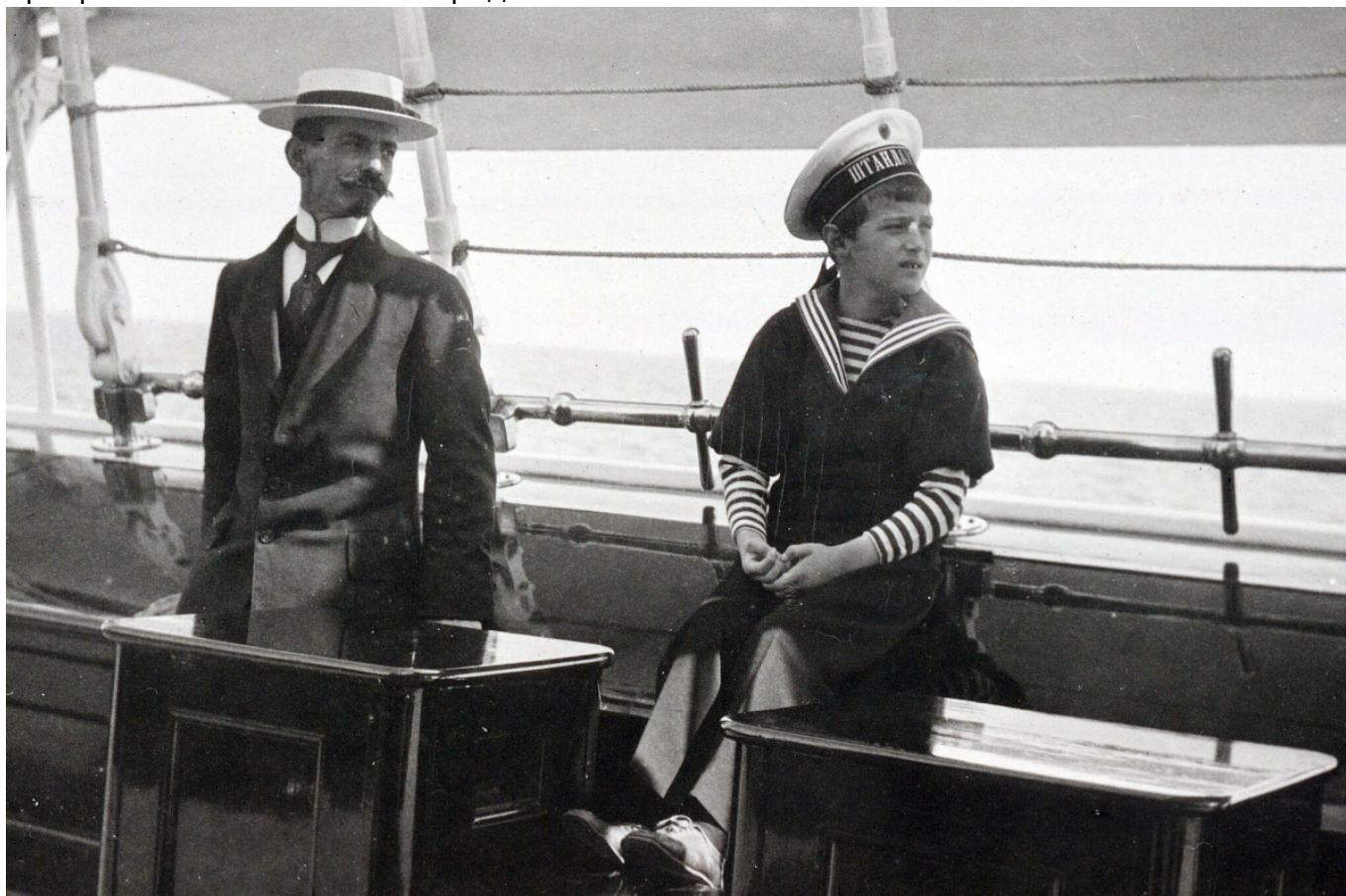
Наставник и ученик: Пьер Жильяр и Алексей Николаевич на яхте Штандарт

Пьер Жильяр не забывал свою родину – каждое лето имел обыкновение ездить в Швейцарию. В 1913 году перед его отъездом императрица сообщила, что по его возвращении собирается доверить ему обязанности наставника Алексея Николаевича. «Это известие преисполнило меня одновременно радости и страха. [...] Я чувствовал, однако, что не имею права уклониться от тяжелой задачи, которая мне предстояла». Наследнику исполнилось девять лет. Он был долгожданным ребенком Николая Александровича и Александры Федоровны, центром этой сплоченной семьи. Когда после четырех дочерей у императрицы, наконец, родился сын, радости Николая не было границ. Впрочем, недолго длилось счастье: вскоре обнаружилось, что наследник болен гемофилией, которую он унаследовал от матери. Любое падение, ушиб, порез могли вызвать смертельное кровотечение. Жизнь его матери превратилась в сплошное страдание.