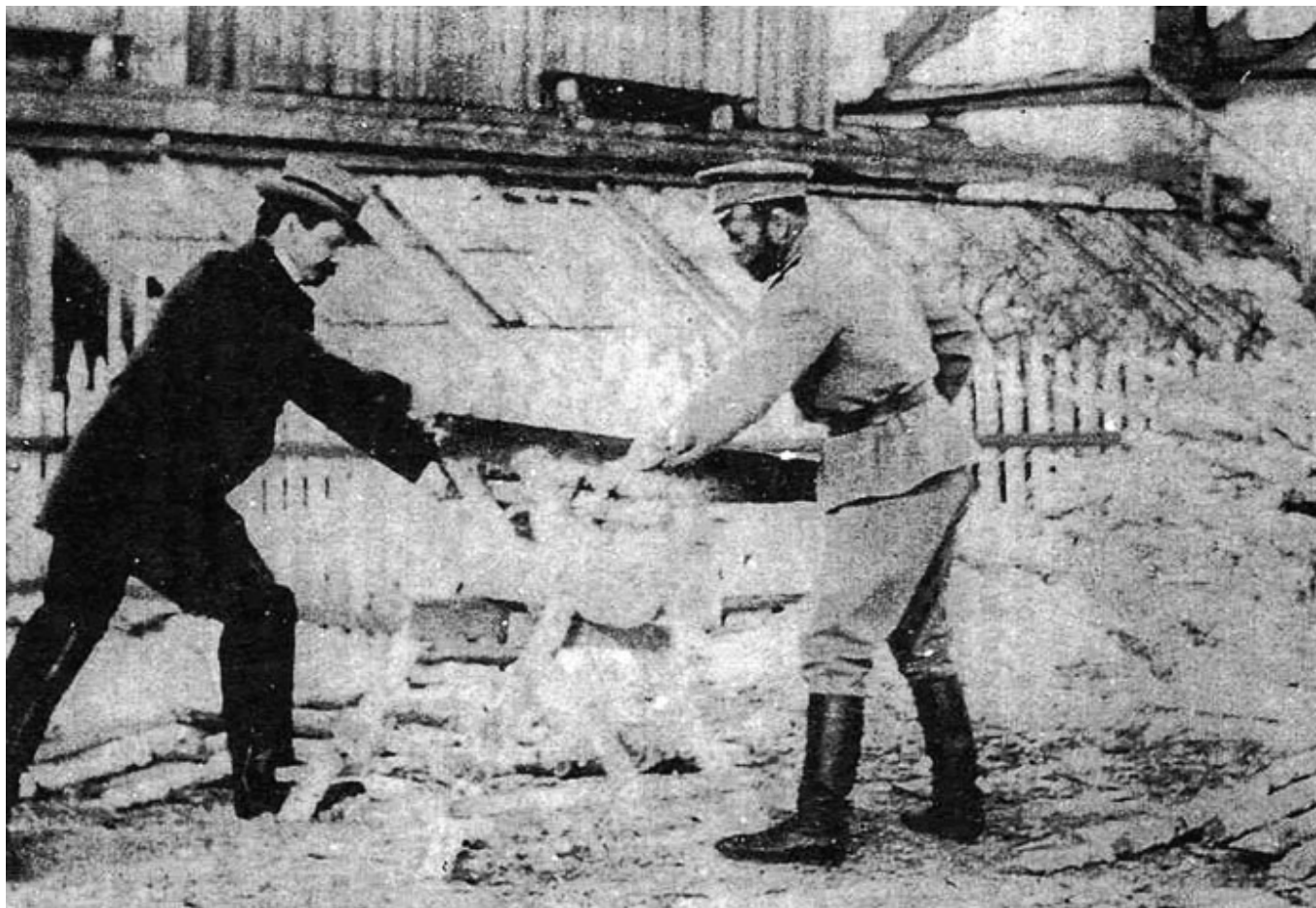
Пьер Жильяр и Николай Александрович пилят дрова во дворе Царскосельского дворца, 1917 год

А на последней странице своей книги о семье Николая II Жильяр написал: «И смерть пришла. Но ей претило разлучать тех, кого жизнь так тесно сплотила, и она взяла их всех семерых, соединенных одной верой и одною любовью. [...] Государь и Государыня верили, что умирают мучениками за свою родину – они умерли мучениками за человечество. Их истинное величие не проистекало от их царственного сана, а от удивительной нравственной чистоты, до которой они постепенно поднялись. И в самом своем уничтожении они были поразительным проявлением той удивительной ясности души, против которой бессильны всякое насилие и ярость и которая торжествует в самой смерти».