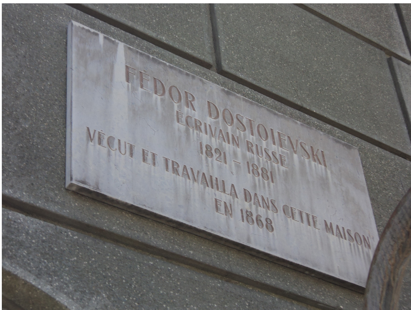
Мемориальная доска на доме Достоевского.

В прошлом году Наша Газета посвятила ряд статей женевскому периоду жизни Ф. М. Достоевского и памяти, которую оставило в Женеве пребывание в ней великого русского писателя. Продолжим тему.