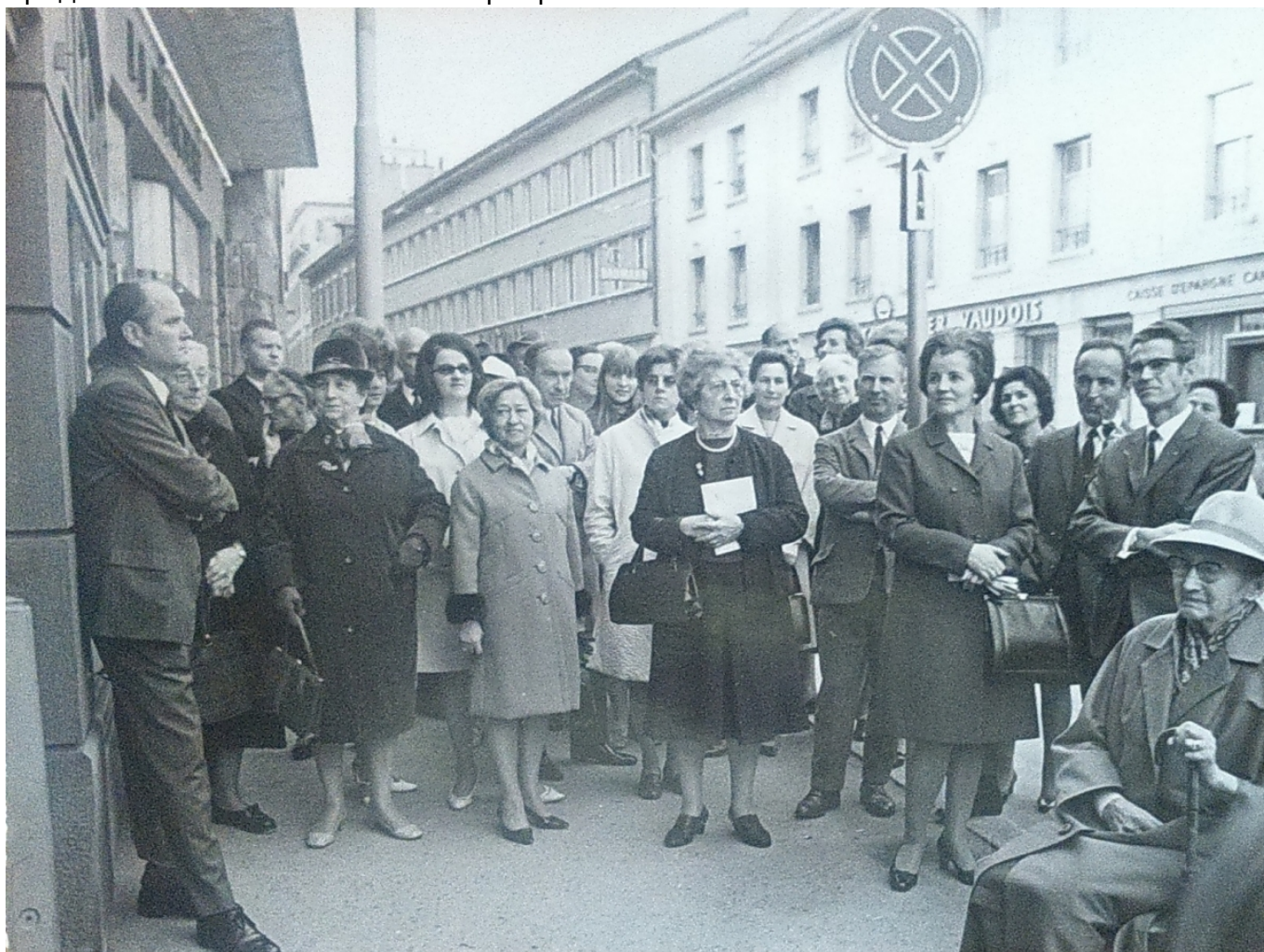
Публика на открытии мемориальной доски. 31 октября 1968 г.