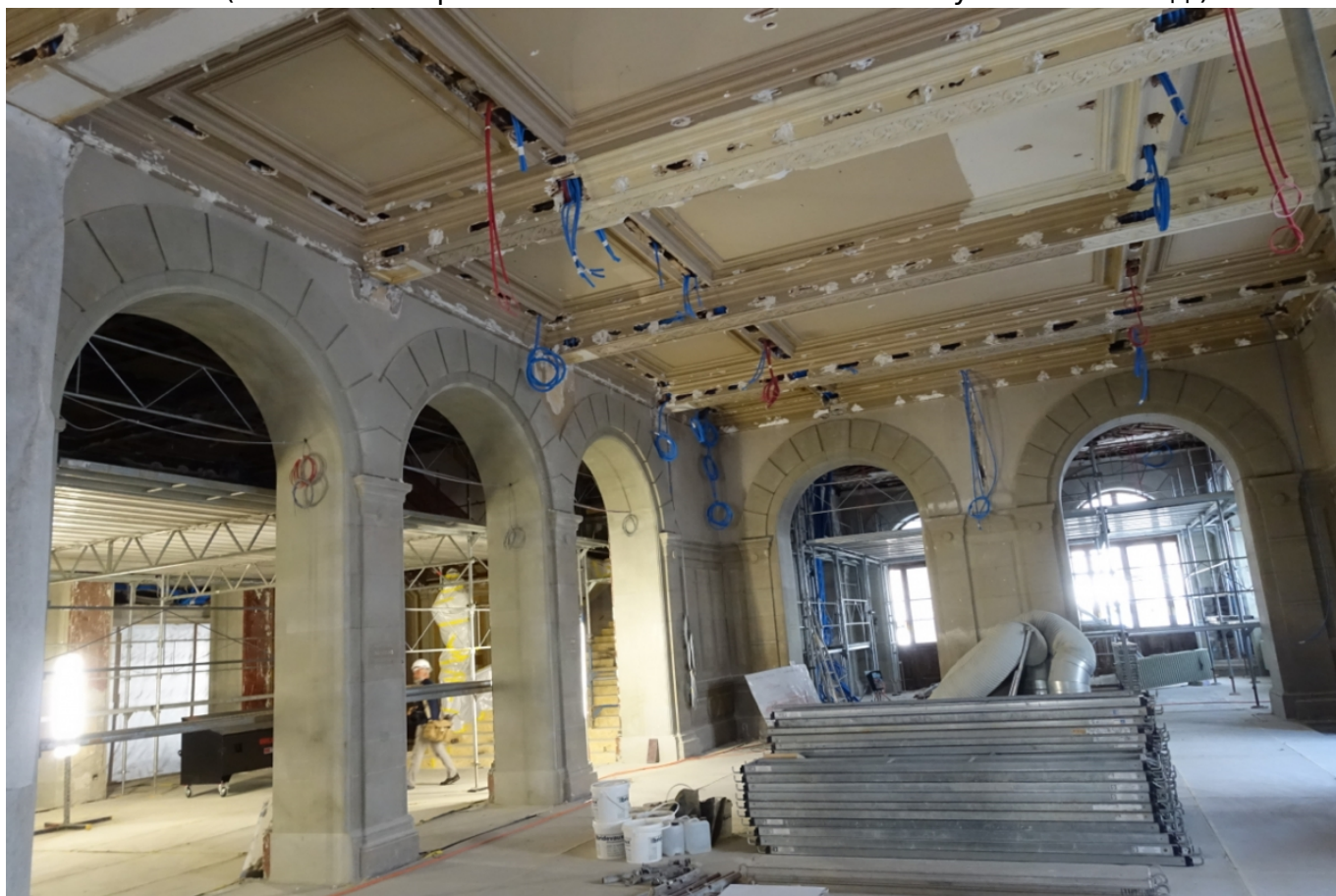
Главное фойе

фойе и библиотека. Под руководством польского скульптора Ячека Стриженски зрительный зал был полностью переделан женеvским архитектором Шарлем Шапфером и его миланским коллегой Марчелло Завелани-Росси – даже в этом «составе» отражается интернациональность Женевы, более 40% населения которой сегодня составляют иностранцы. Открытый 12 декабря 1962 года, новый зал вмещал уже 1500 зрителей. И с тех пор не ремонтировался, так что тянуть дальше было нельзя – ни с точки зрения эстетики (здание обветшало), ни с точки зрения техники безопасности (из любой искры могло в любой момент вспыхнуть пламя и т.д.).