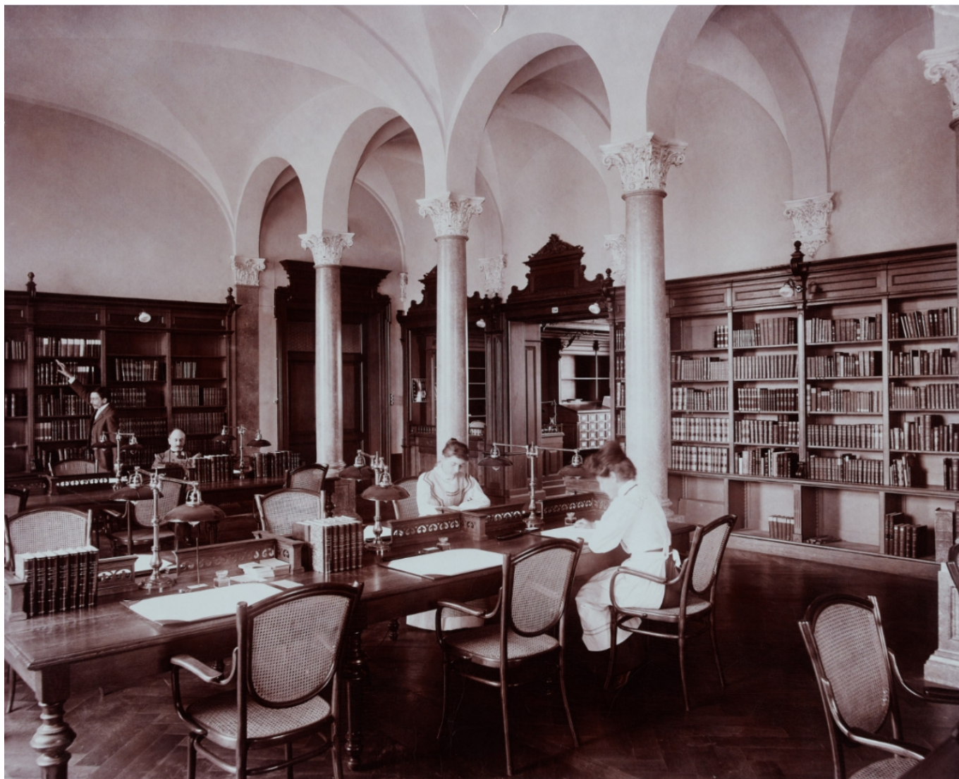
Так выглядела Национальная библиотека в Берне, когда там занимался В. И. Ленин