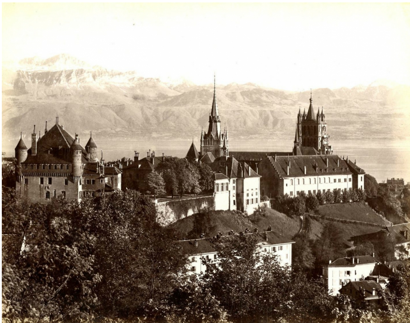
Лозаннский собор, XIX век

Кроме того, факультет протестантской теологии Женевского университета вводит цикл лекций, посвященный католическому богословию – это сделано по согласованию с деканом римско-католической церкви Женевы Жаном-Даниэлем Макки. В том числе, в городе Кальвина будут преподавать основы догматического учения о Деве Марии.