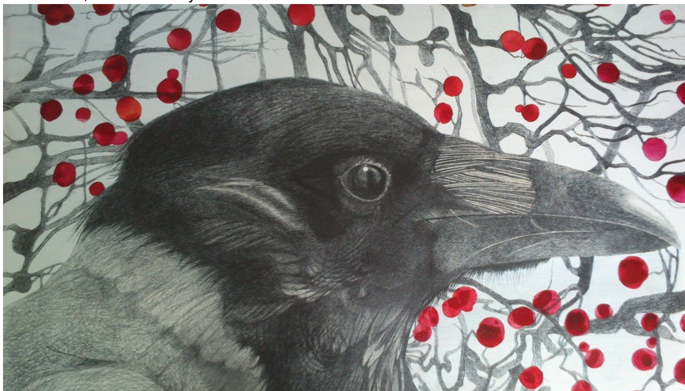
Еще одна симпатичная ворона - с картины "All for you" © Tanja Schumacher

Конечно! Меня часто критикуют близкие. Иногда я работаю над картиной и чувствую, что что-то идет не так. Нужно что-то переделать, а не хочется. Хочется с удобством дорисовать и закончить. И тут приходит кто-то из моих членов семьи и говорит именно то, что я не хочу слышать.