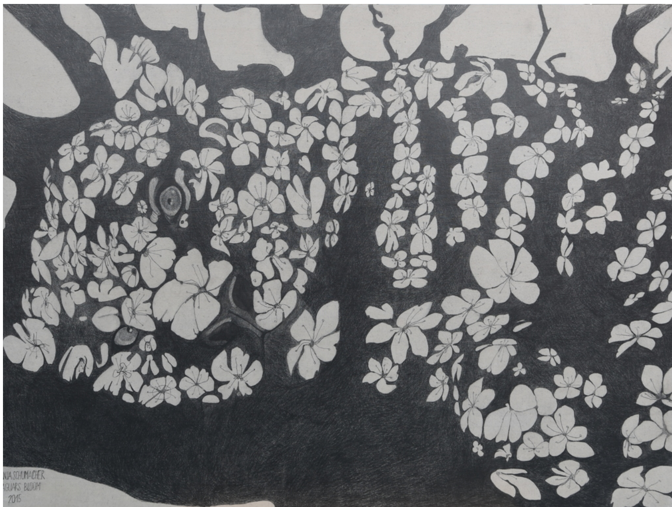
Мы и животные – одна семья, говорит Татьяна. Jaguars bloom © Tanja Schumacher 5

Какого художника Вы могли бы назвать своим виртуальным учителем, если вообще такой есть?