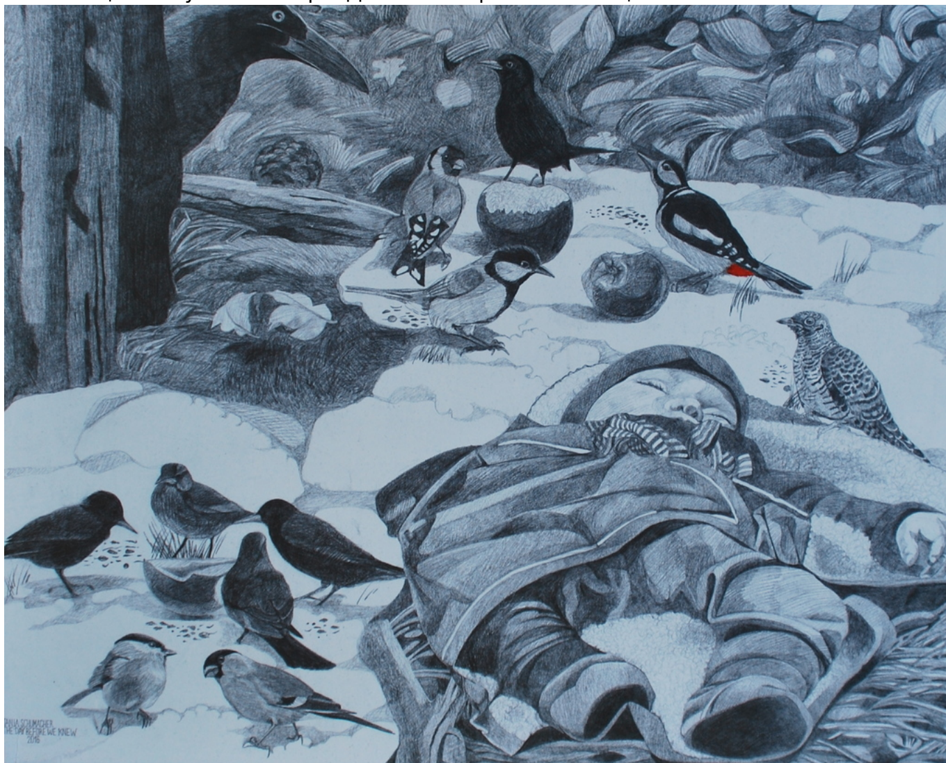
Вороны напоминают Тане о Москве. The day before we knew

Это мудрая птица, которая всегда находит, как ей выжить, приспосабливается к любому климату, к любым условиям и даже к человеку, что непросто. Мне кажется, у этих птиц есть чувство юмора. Для меня вороны – это еще и напоминание о Москве.