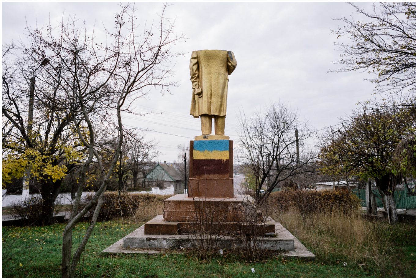
Шабо, Одесская область, 21 ноября 2015 г.