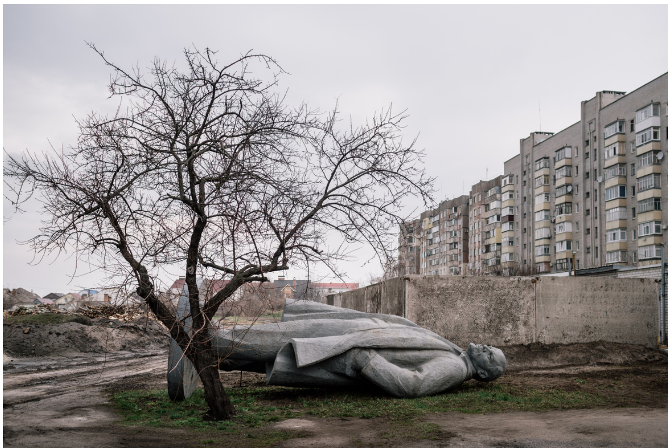
Кременчук, 30 марта 2016 г.

Нам показалось интересным процитировать несколько цитат из включенных в альбом интервью, служащих исчерпывающими комментариями к 70 вошедшим в него фотографиям.