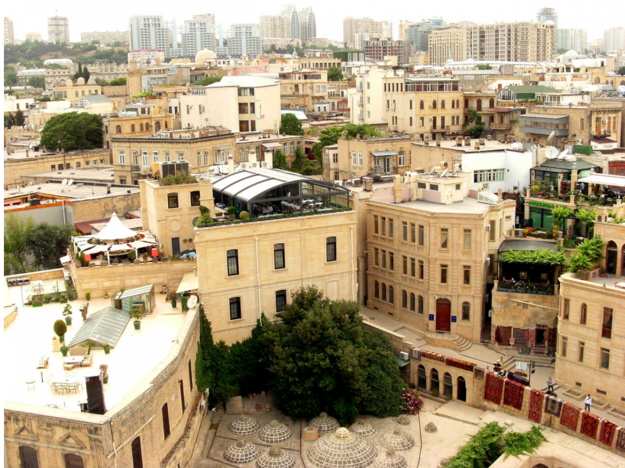
Архитектура Баку

Кстати, в своей работе я опираюсь и на проект, совместно реализуемый Францией и швейцарскими кантонами Во и Женева (Agglomération franco-valdo-genevoise). Созданная для сохранения экологической идентичности альпийского региона, хотя проект также включает транспорта и жилья, эта агломерация вышла за рамки административных единиц. Экологические коридоры, фактор воды и экологии – все это определяет характер территории. Смысл в том, что прежде чем начинать что-то проектировать, нужно сначала изучить эти факторы. Экология территории – это матрица, внутренняя структура любого проекта, который будет реализован, чтобы ответить на демографические вызовы. То есть вопрос транспорта и жилья не должен противоречить экологическому фактору, а территория сама определяет свое будущее.