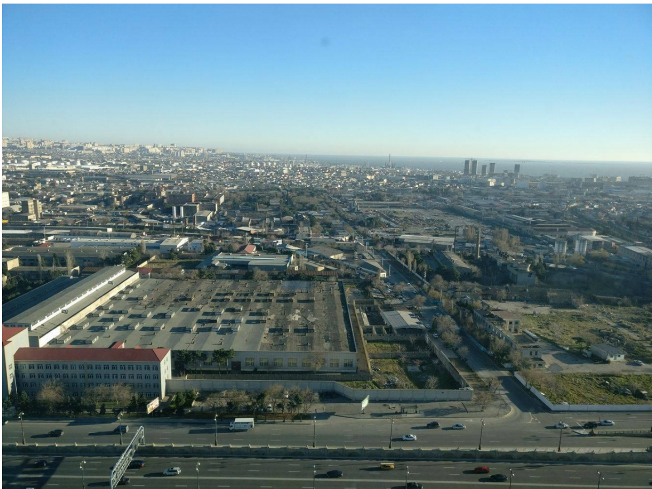
Так выглядит сегодня индустриальная часть Баку

В советское время обращалось меньше внимания на экологический фактор. Плюс ко всему, стоимость участков регулировалась государством, а власти не видели интереса в реабилитации этих территорий. Новые кварталы строились вокруг индустриальной зоны, и город начал расширяться на север и на восток. Нынешний муниципалитет и правительство оказались в сложной ситуации: историческую культурную и экономическую (на западе) с «советской» (на востоке) частью города связывают всего три автомобильные дороги, проходящие через центр и огражденные заборами, чтобы их пользователи не видели эту постиндустриальную территорию. Как решить эту проблему?