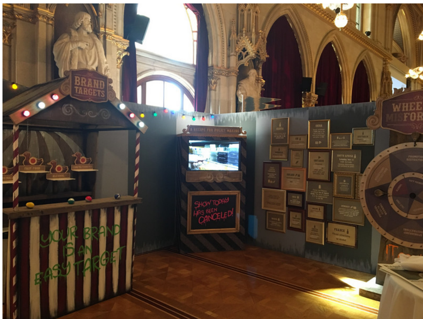
"Будущее брендов"

Несмотря на всю серьезность темы, которую уже затрагивала на своих страницах Наша Газета.ch, лейтмотивом выставки стал... цирк – вместо привычных стендов и панно здесь используются знакомые всем цирковые аттракционы и прочие «фокусы». Надо сказать, устроители выставки проявили большую изобретательность, каждый экспонат заслуживает внимательного рассмотрения. Вот, например, «Wheel of misfortune» (жаль, не скажешь по-русски «колесо мисфортуну», приходится обойтись «неудачей») отражает растущее распространение чрезмерных законодательных ограничений на разные виды продукции – кто знает, кто станет следующей жертвой? «Крутаните колесо, чтобы увидеть, как ограничения влияют на каждую категорию изделий. Потратьте несколько минут, чтобы внимательно изучить набор запретов – может получиться быстрее, чем вы думаете!» Или вот еще забавно – рецепт для производства фильма о формировании политики. Посмотрев короткий фильм о клоунах, посетитель получит четкое представление о провале действий правительственных организаций. Мораль – чрезмерные законодательные ограничения могут быть рецептом катастрофы! Да и чисто по-человечески, запретный плод всегда только еще более сладок.