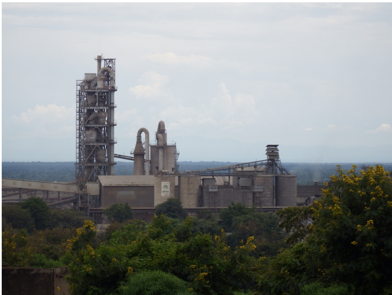
Цементный завод Hima Cement в Уганде – дочернее предприятие концерна LafargeHolcim

Статья Бруно Мейерфельда была опубликована в марте 2016 года и вызвала огромный резонанс. СМИ и общественные организации интересовались, как известный цементный концерн мог допустить такое грубое нарушение прав ребенка, человека и техники безопасности, и выражали сомнения, что руководство все это время ни о чем не подозревало.