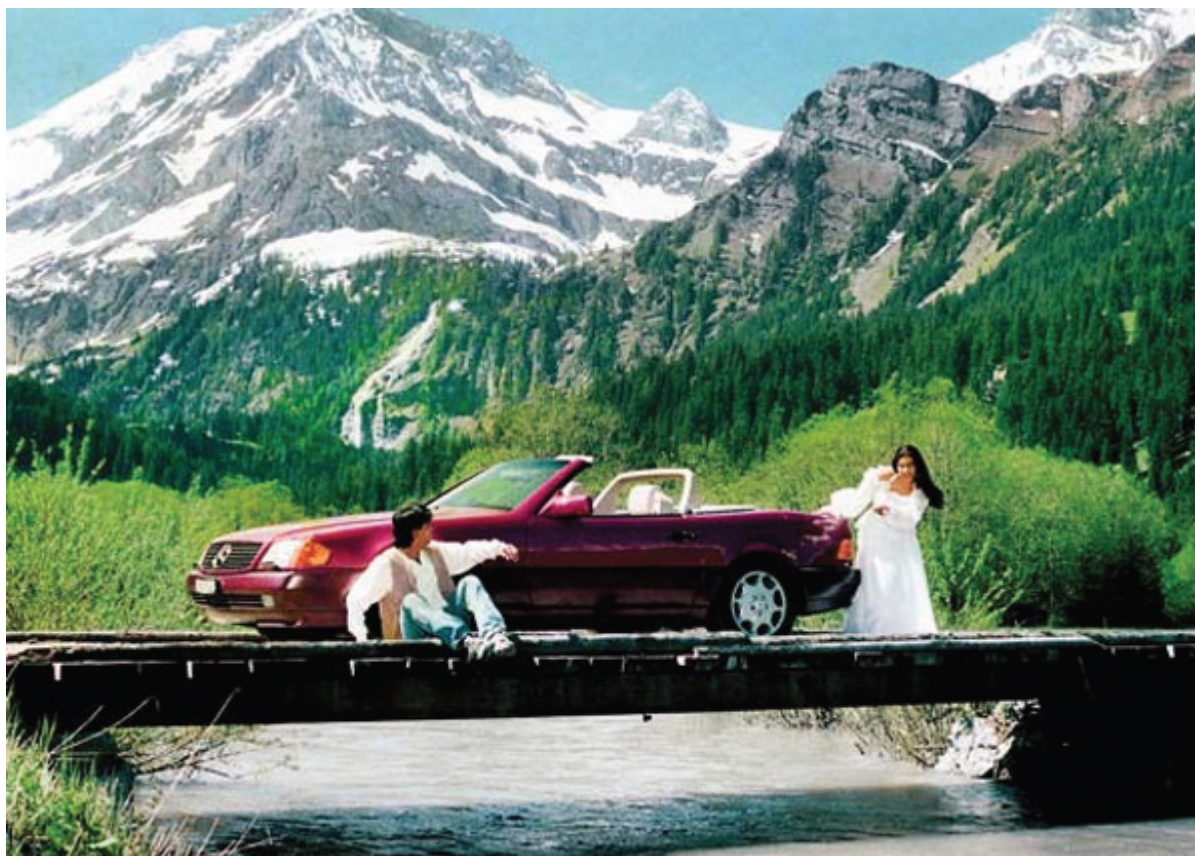
Индийцы любят снимать фильмы в Швейцарии