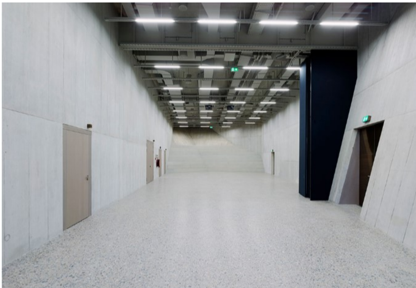
Аудитория Вилли Хирцеля

Когда женеvский арт-критик Этьен Дюмон сравнил это крыло музея с пригородным супермаркетом, а интерьер – с подземной парковкой, он не преувеличивал. Аудитория, в которой проходил семинар, напоминает даже не столько парковку, сколько бункер: серые бетонные стены, металлические двери, окон нет. Единственным источником света в темном зале служил проектор. На экране светился слайд: Ленин на броневике, портрет Николая II, красные флаги и большие цифры «1917».