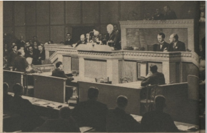
1934 Du haut de la tribune de la Société des Nations, M. Motta, chef du Département politique fédéral, s'oppose au nom de la Suisse à l'admission de l'U. R. S. S. au sein de l'institution de Genève.