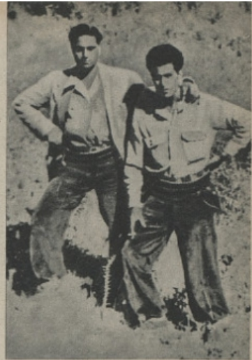
Enfin une photo de Giuliano !

Le Foreign Office opéra alors un savant demi-tour. M. Attlee parla d'un voyage du comte Sforza à Londres, et des parlementaires britanniques accoururent à Rome faire une visite de bonne volonté; ils furent reçus à bras ouverts; et en leur honneur, l'Opéra donna Iris de Mascagni. Mais le pape les gratifia de quelque avertissement, allusion à peine voilée aux responsabilités de qui tient en mains rênes ou ficelles. Bref, au cours de la très courte visite de M. Schuman à Londres,