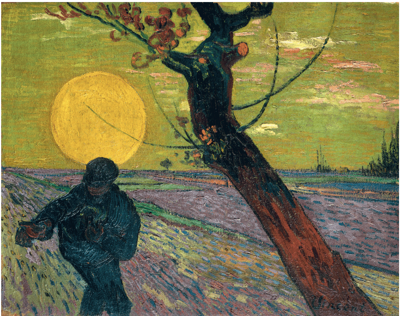
Винсент Ван Гог. Сеятель на закате солнца, 1888. Масло, холст, 73 x 92 см (Fondation Collection E.G. Bührle, Zurich)

Такая возможность предоставлена всем любителям живописи в ближайшие несколько месяцев, достаточно добраться до Лозанны, проехать (или пройти) по ее извилистым улочкам и оказаться в изысканном музее, расположенном в вилле 19 века, принадлежавшей банкиру Шарлю-Жусту Буньону и переданной его наследниками городу в 1976 году. В течение последних двадцати лет особым направлением деятельности Фонда Эрмитаж стало изучение крупных частных швейцарских коллекций, так что нынешняя экспозиция, куратором которой выступил директор цюрихского Фонда Коллекции Э. Г. Бюрле Лукас Глоор, – логическое развитие проводимой работы.