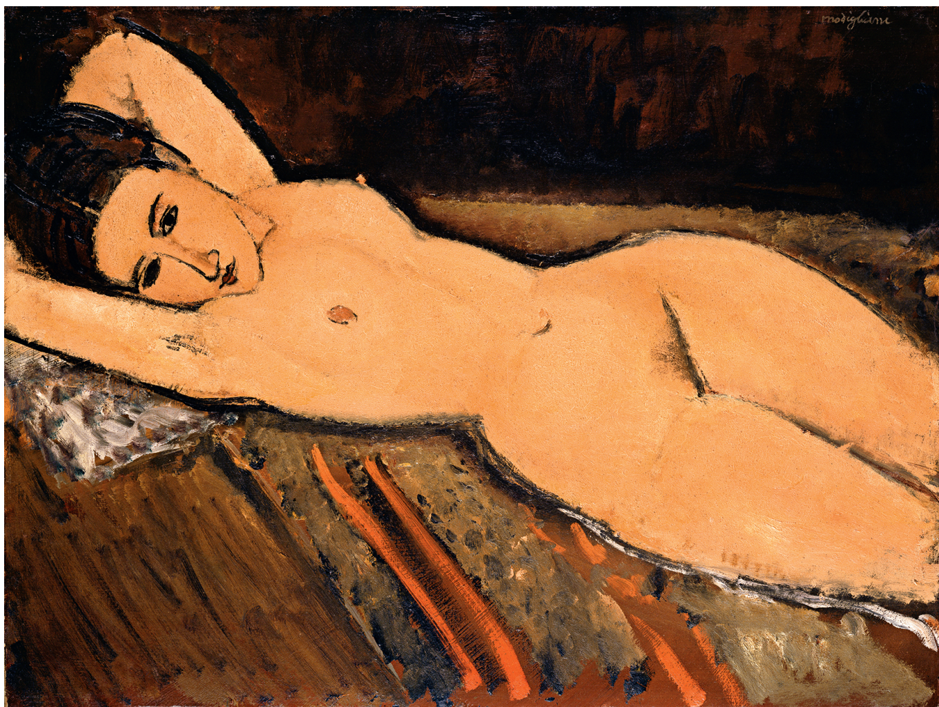
Амедео Модильяни. Лежащая обнаженная, 1916. 65,5 x 87 см

Автор: Надежда Сикорская, Лозанна , 10.04.2017.