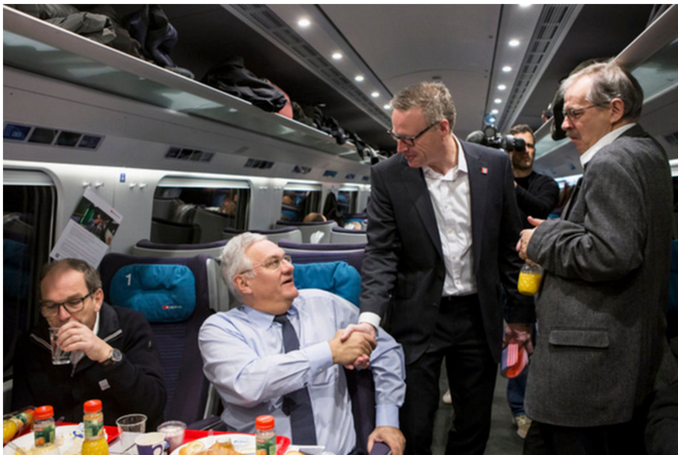
Глава CFF приветствует первых пассажиров, пересекающих Готардский туннель

При свете электрического освещения пассажиры продолжают дремать, читать или смотреть видео, никак не проявляя своего восторга. Фотографировать за окном нечего, лишь дают о себе знать заложенные от перепада давления уши. Похоже, что главный признак посещения исторического туннеля – исчезнувшие на долгие 20 минут головокружительные пейзажи за окном.