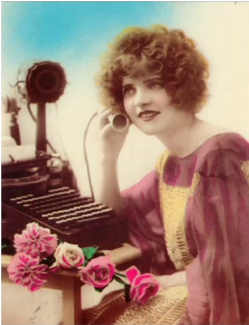
Машинистка слушает!

Летом 2014 года в лондонской редакции газеты Times из специально установленного динамика послышался треск пишущих машинок, что должно было стимулировать работу журналистов. Чем ближе становился момент сдачи номера, тем больше нарастал звук из прошлого, которого в стенах редакции не было слышно с 80-х годов XX века.