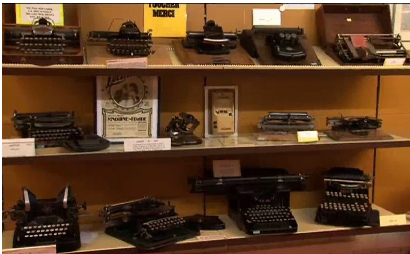
«Печатная» старина на полках музея

Даже первые, самые громоздкие ламповые ЭВМ казались людям XX века чудом техники. А когда в 90-е годы гораздо более удобные в использовании компьютеры стали вытеснять старые испытанные устройства, многие вздохнули с облегчением – прогресс! Однако с течением времени некоторых потянуло к старине: захотелось вновь окунуться в атмосферу послевоенных лет, когда будущее, казалось, готовило столько полезных открытий, когда все были преисполнены надежд на торжество светлого человеческого разума... Да и соображения безопасности подсказывали, что исключительно на электронику полагаться нельзя.