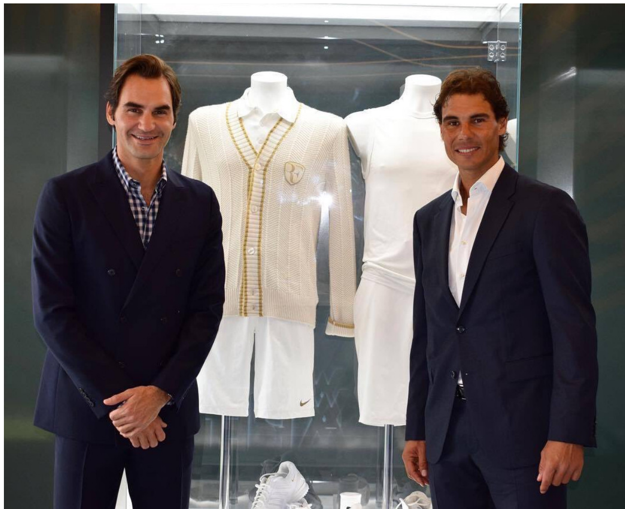
На открытии Теннисной академии Рафаэля Надаля

операции. Федерер никогда ничего не делает просто так, пишет швейцарская пресса.