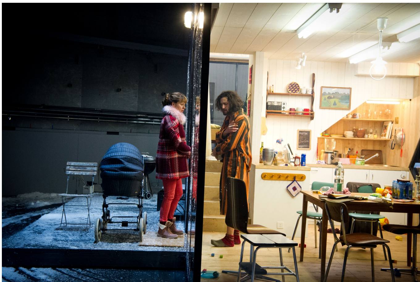
Сцена из спектакля "Три сестры"

Автор: Людмила Майер-Бабкина, Базель , 13.12.2016.