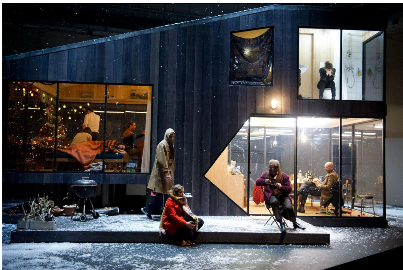
Сцена из спектакля "Три сестры"

Разгадка странной трактовки пьесы «Три сестры» наступает, когда вдруг начинаешь различать, что на кухне сценического дома в большом количестве присутствуют пакеты с продуктами из швейцарского магазина «Migros», и что сами герои, а не только их имена и одежда, - швейцарцы. Их лексикон, щедрые, беззастенчивые ругательства вслух - швейцарские, их простецкие грубоватые отношения с друг другом - швейцарские, их гендерная перепутанность, соответствующая тематика разговоров, открытые всем интимные отношения - тоже швейцарские.