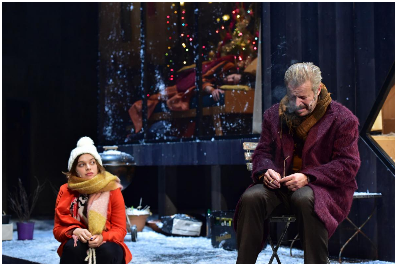
Сцена из спектакля "Три сестры"

Знаменитые чеховские паузы, «накрытые» повседневной скороговорной речью, по нашим наблюдениям «переместились» из диалогов персонажей на сцене в диалог публики с театром. Сценическое действие и погружение в финале в темноту заставили ставить вопросы, сравнивать, узнавать неприглядную правду о себе и, возможно, что-то пересматривать в своем образе жизни. Спектакль задел за живое многих. Об этом свидетельствовало напряжённое внимание зрительного зала и очень продолжительные аплодисменты: публика, не сговариваясь, аплодировала не только руками, но и, по-швейцарски слаженно и организованно, ногами... будто коллективно винясь и соглашаясь с театром.