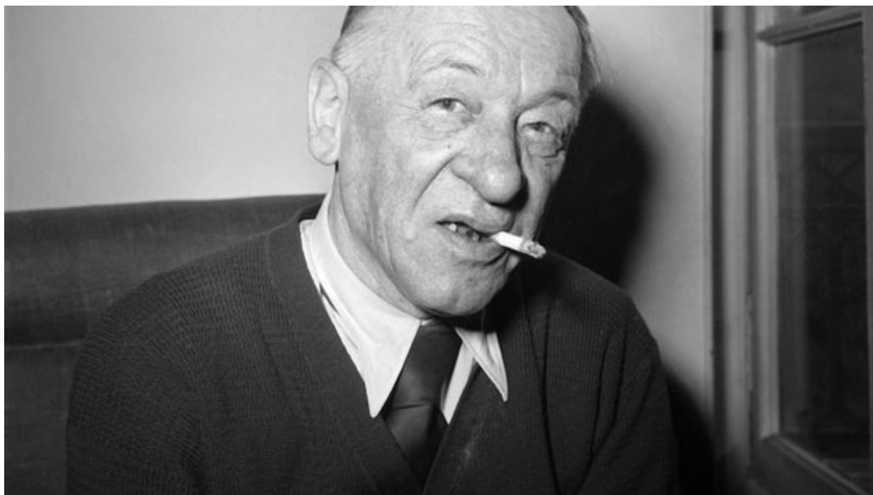
Блез Сандрар (1887 - 1961)

Автор: Михаил Яснов, Санкт-Петербург , 30.09.2016.