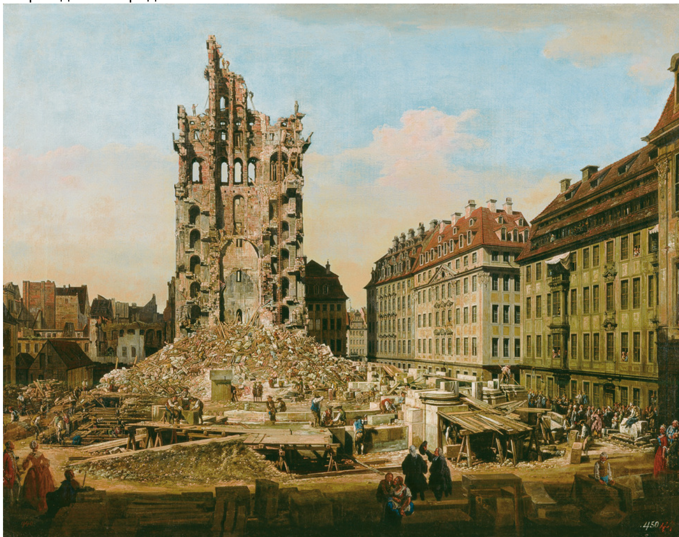
Бернардо Беллотто. "Развалины церкви Святого Креста в Дрездене" (1765). Масло, холст, 84,5 x 107,3 см (Kunsthhaus Zürich, Fondation Betty et David Koetser)

церкви нетронутым домам городской буржуазии на заднем плане и новому строящемуся зданию. Таким образом этот свидетель эпохи дает зрителю надежду на возрождение города.