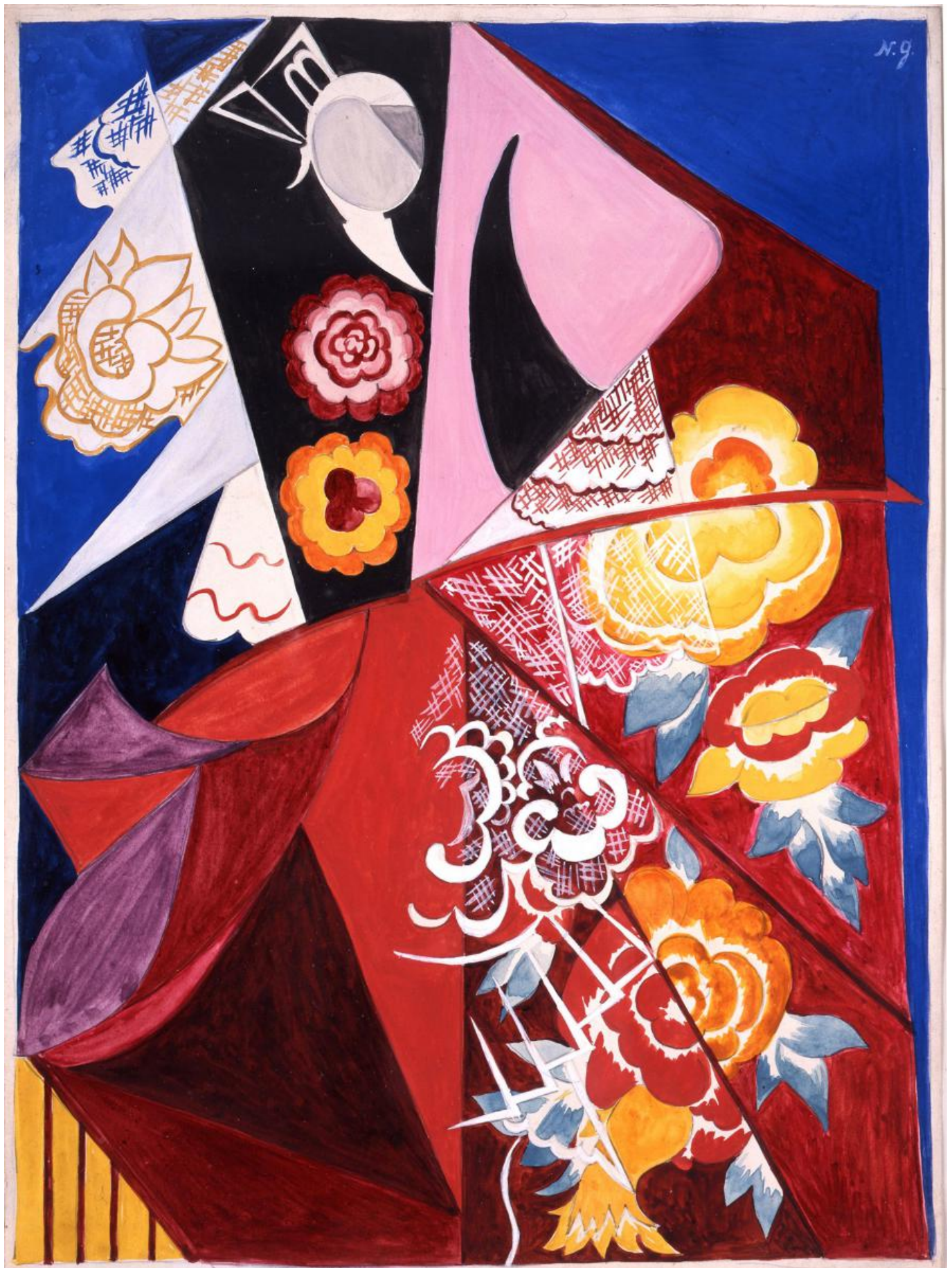
Наталья Гончарова. Espagnole cubiste . 1915/16. Гуашь, картон. 28,5 x 21 см Collezione Olgiati, Lugano