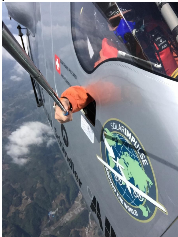
Селфи над Китаем

Непосредственное участие в проекте принимали около 150 человек , включая исследователей и ответственных за связи с общественностью. В 2003 году коллектив насчитывал четырех основателей, в 2012-м над общей задачей увлеченно трудились уже 70 человек, а к июлю этого года цифра удвоилась.