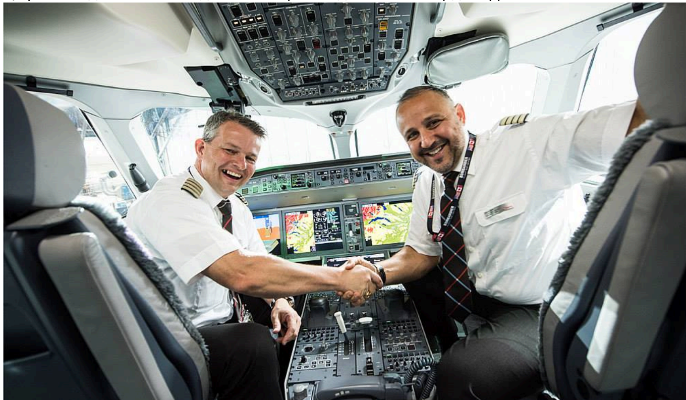
Довольные пилоты SWISS