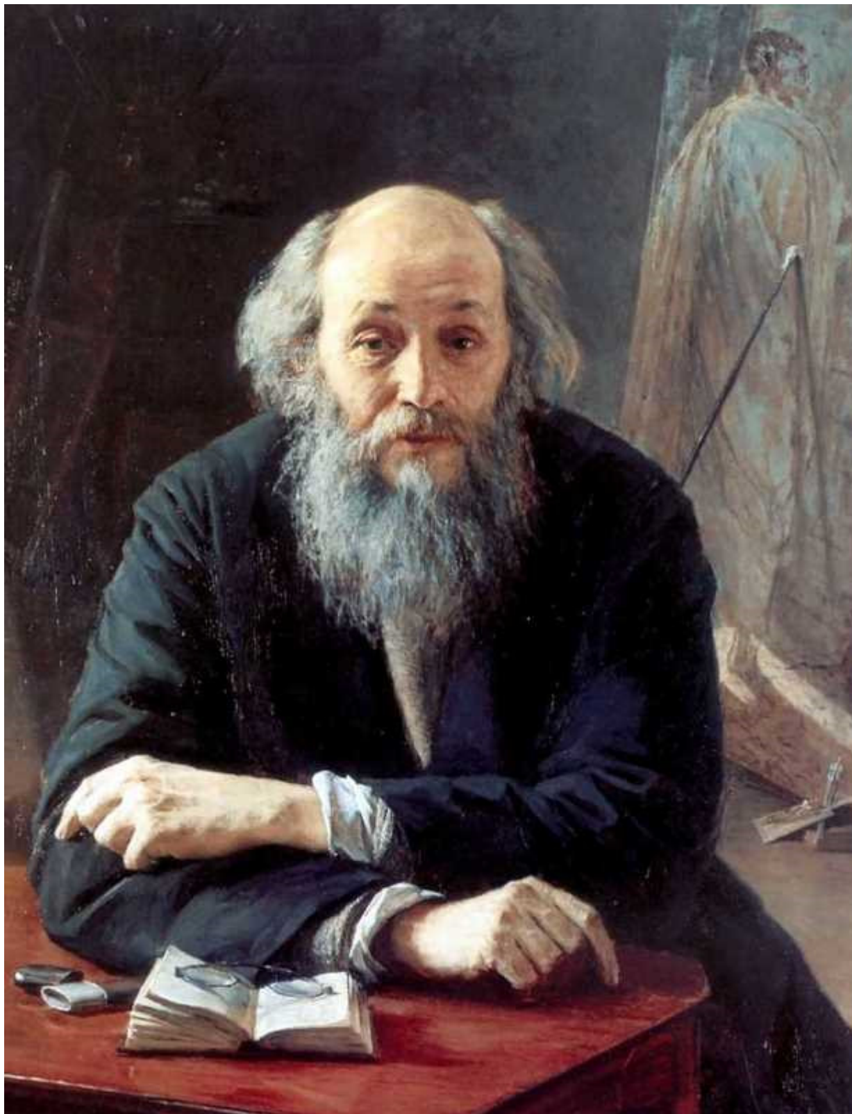
Ярошенко Н.А. Портрет художника Николая Николаевича Ге, 1890 г., Холст, масло 92,5 x 73,5, Государственный Русский музей

Николай Николаевич Ге получил за свою картину «Аэндорская волшебница вызывает тень Самуила», написанную в академических традициях, большую золотую медаль и право стажировки за границей. Вместе с женой он отправился в Италию, они прожили в там тринадцать лет – сначала в Риме, позднее во Флоренции. В 1857 году в Риме родился их первый сын, которого назвали в честь отца. Вернувшись в Россию, Ге в течение нескольких лет принимал активнейшее участие в работе Товарищества