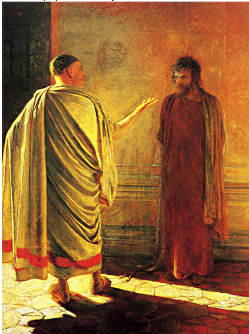
Н.Н. Ге. «Что есть истина?» Христос и Пилат. 1890 , холст, масло. 233 x 171 см, Государственная Третьяковская галерея

Синедриона» представлены в помещении, закрытом для широкой публики. Видимо, это и явилось причиной того, что после смерти Третьякова Николай Ге решает забрать часть произведений отца из галереи, тем более что Совет, назначенный Третьяковым для ведения дел в галерее после его смерти, был только рад избавиться от произведений, с которыми они не знали, что и делать. Вот так и получилось, что большая часть рисунков, переданных в дар Третьяковской галерее, вновь вернулась к сыну Николая Николаевича Ге и впоследствии оказалась в Женеве.