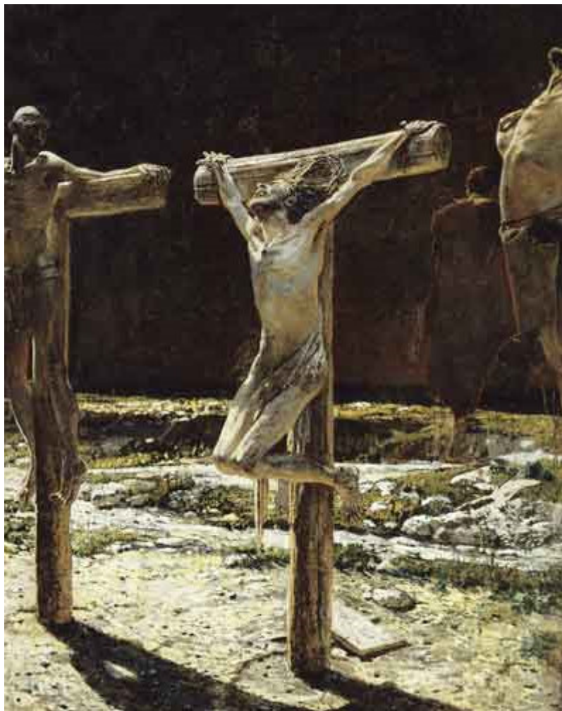
Н.Н. Ге "Распятие". 1892. Холст, масло. Музей Орсе, Париж.

Последующие полотна Ге и вовсе привели к скандалу. Характерно, что их не понимала не только публика, но и собратья по кисти, находя, что их язык близок к гротеску. В 1892 году его картина «Суд синедриона» не была допущена на очередную выставку Товарищества передвижников.