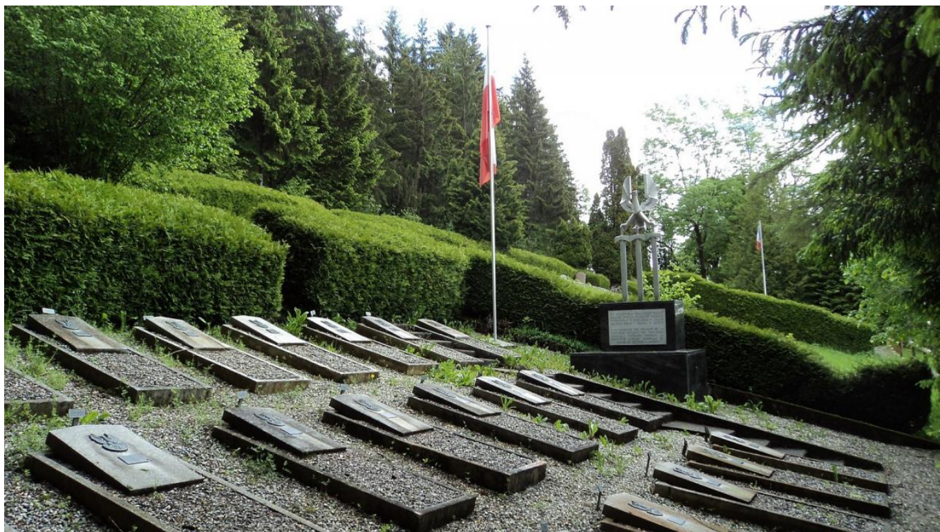
Польское военное кладбище в Лейзане. Фото автора. Июнь 2016 г.

На 2016-й год в Лейзане нет больше ни одной русской могилы, но память о мировых войнах в деревне все-таки трепетно хранится. В ста метрах от муниципального кладбища Ларре, еще полвека назад бывшем в значительной степени «русским», сквозь зелень видны на флагштоках сине-бело-красный и бело-красный флаги. Здесь находятся охраняемые соответствующими правительствами французское военное кладбище Первой мировой войны (помимо французских солдат и офицеров там еще покоятся несколько англичан и бельгийцев) и польское кладбище Второй мировой. Аккуратные таблички, кресты, указания званий и наград. В Лейзане лечились от ран и болезней солдаты разных армий. К сожалению, излечивались не все.