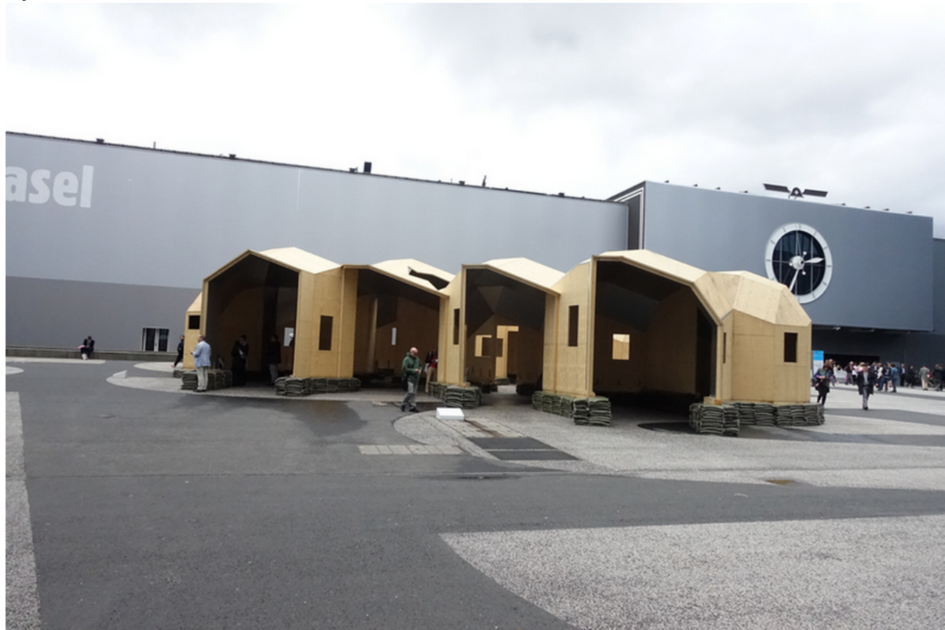
Оскар Туазон, "Zome Alloy"

Ну, это то, что касается «нас». А что же в остальном?