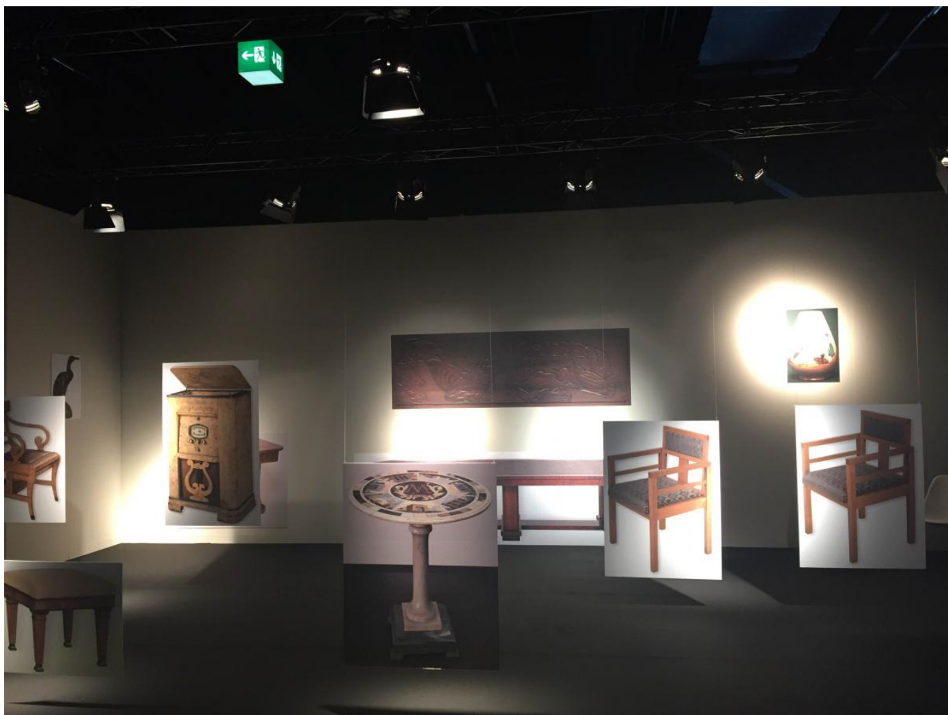
Так выглядит стенд галереи Heritage на Art Basel

Basel/Miami/Design, сообщил, что на стенде московской галереи «Heritage» вместо «обещанной» мебели сталинской эпохи (об этой коллекции мы писали в прошлом году) оказались одни фотографии, правда, в натуральную величину. На сопровождающем стенд панно посетители могут прочитать, что предназначенные для выставки предметы не пропустило российское Министерство культуры. Разумеется, мы захотели подробностей, для чего связались с галеристом Кристиной Краснянской. Она подтвердила, что, в отличие от предыдущих лет, на этот раз Министерство культуры РФ не дало добро на временный вывоз экспонатов без государственной (швейцарской) гарантии на их обратный ввоз. (Понятно, что таких гарантий Конфедерация не дает.) Вместо это Минкульт предложил вывести коллекцию насовсем, если галерея заплатит ему 10% от ее стоимости. Приведенное обоснование – Закон РФ о вывозе и ввозе культурных ценностей».