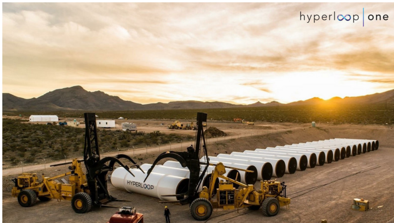
Прокладка труб для Hyperloop в Неваде

Аналогичную систему вакуумных поездов на магнитной подушке, способных развивать скорость около 500 км/ч, еще в конце прошлого века предлагали создать в Швейцарии авторы проекта Swissmetro (подробнее об этом «Наша Газета.ch» уже рассказывала ). Однако отсутствие необходимых средств и политической воли помешали реализации амбициозной идеи, возможно, немного опередившей свое время. Сегодня же, отмечает Родольф Нит, на дорогах появляются электромобили, а скоро наступит очередь машин с автоматическим управлением. Прогресс не стоит на месте, и «на средних и дальних дистанциях такие решения, как Swissmetro и Hyperloop, заменят скоростные поезда и самолеты», убежден инженер.