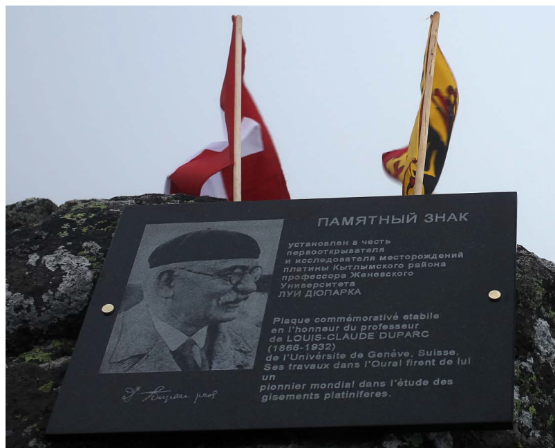
Памятная доска

Мы расскажем об этом путешествии не только потому, что оно имеет непосредственное отношение к герою нашей статьи, но и потому, что оно дает представление, в каких условиях приходилось заниматься любимой работой неугомонному швейцарцу сто лет назад.