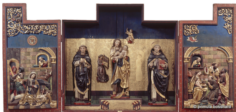
Триптих в монастырской церкви