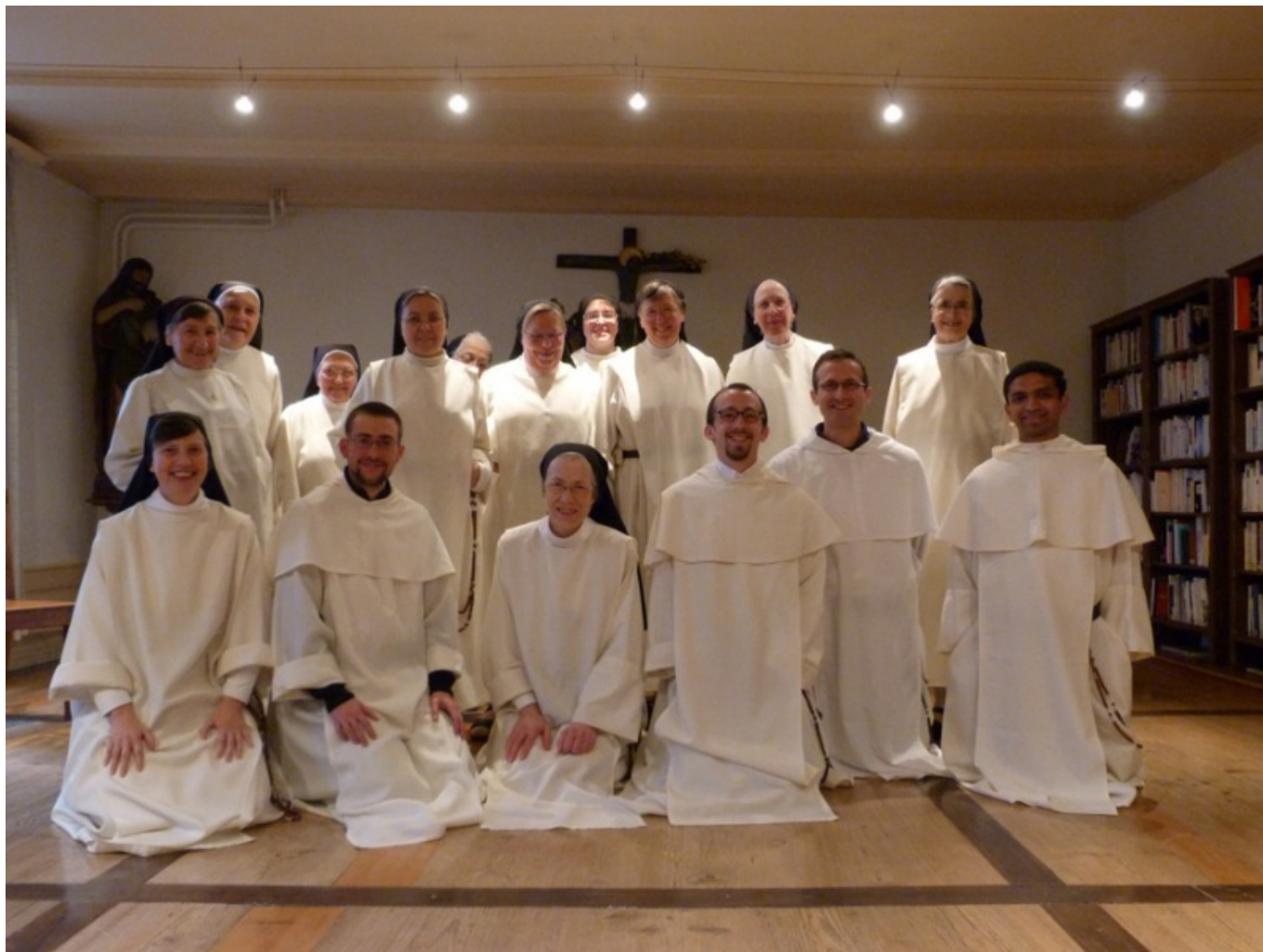
Доминиканки Эставайе сегодня (moniales-op.ch)

Автор: Лейла Бабаева, Эставайе-ле-Лак , 05.05.2016.