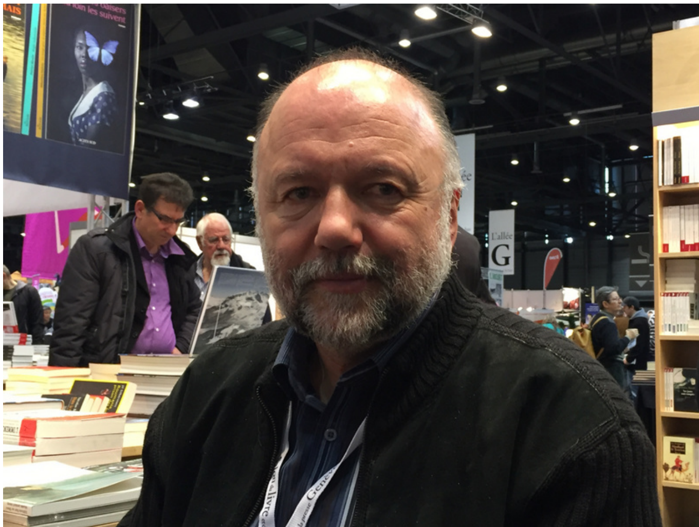
Андрей Курков на Книжном салоне Женевы