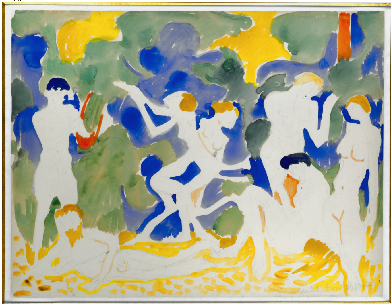
Андре Дерен. La Musique. около 1904-1905 гг. Частная коллекция