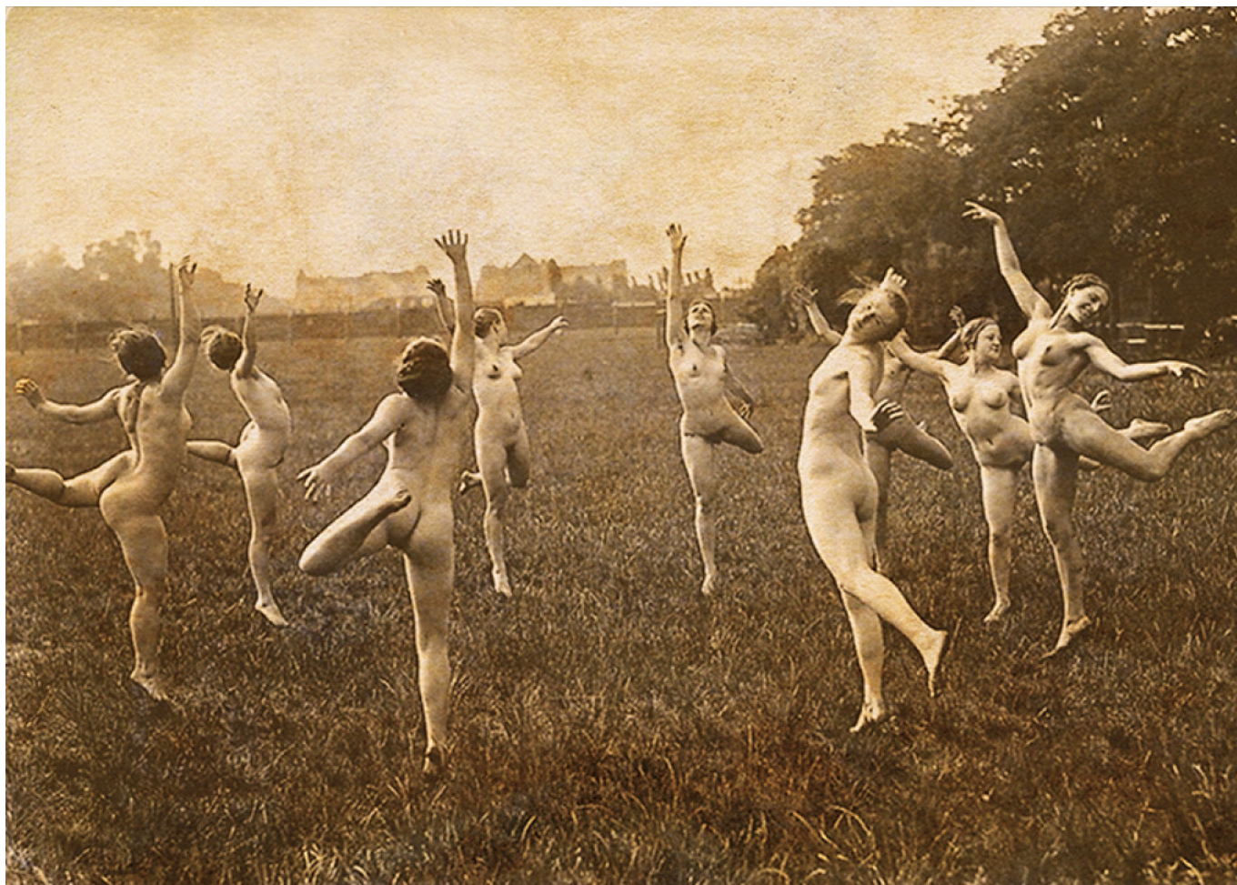
Неизвестный автор. "Танец".

Автор: Надежда Сикорская, Женева , 15.04.2016.