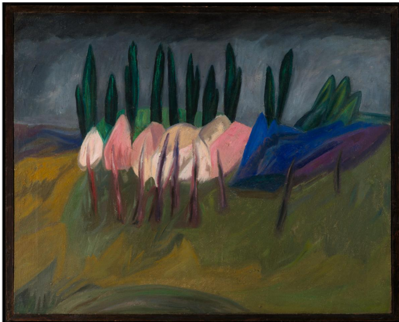
Владимир Бурлюк (1886-1917), Landschaft Blühende Bäume im Frühling , 1911 г. Частная коллекция.

Ключевыми темами выставки стали Танец, Природа и Человеческое тело как формы выражения художественной и духовной свободы. Значительная часть экспозиции посвящена двум движениям, послужившим философскими основами Монте Верита: Lebensreform («реформа жизни»), возникшее в конце 19 – начале 20 века, и Freikörperkultur (культура свободы тела), уходящее корнями еще в 18 век.