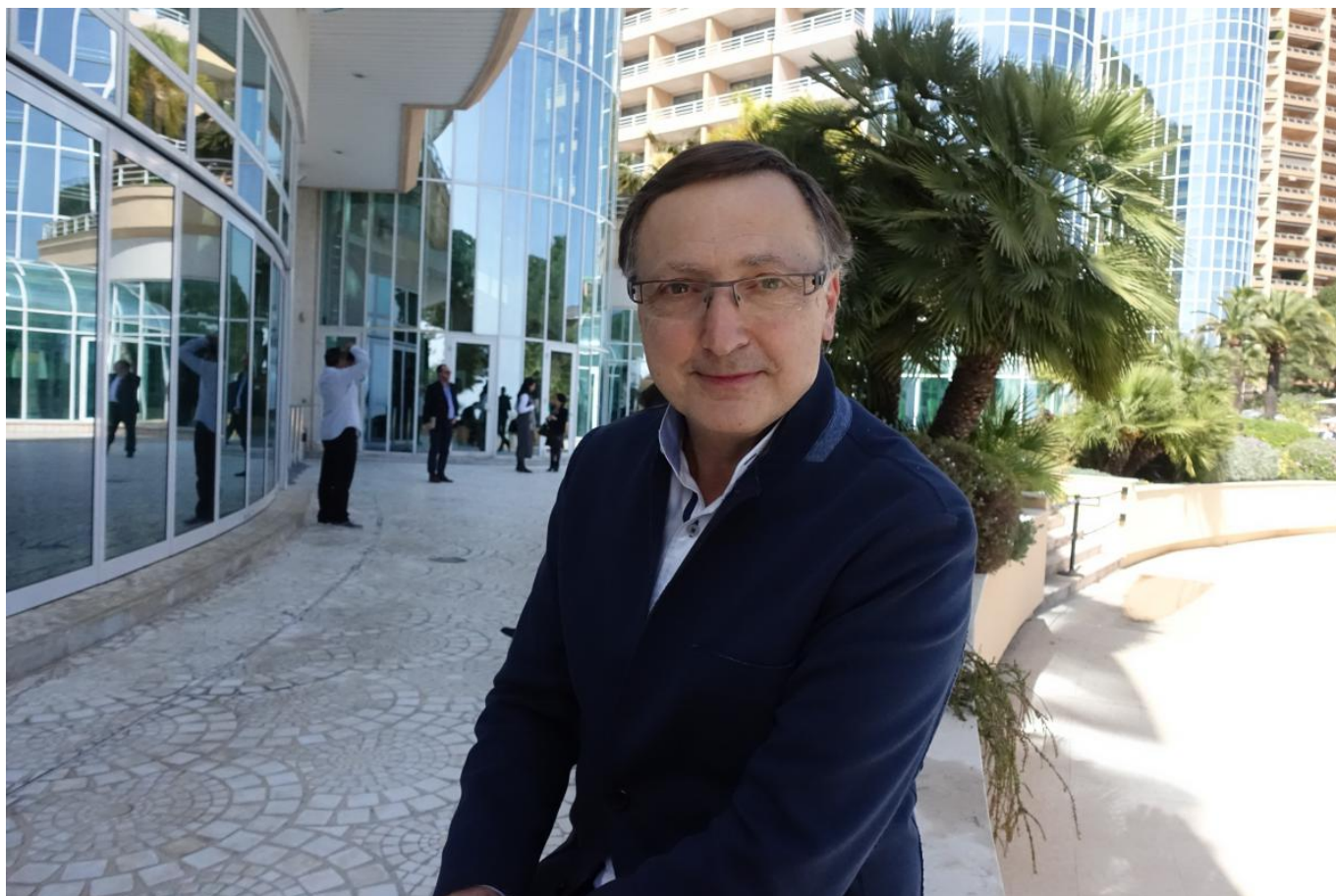
Гуру индустрии люкса Жан-Ноэль Капферер

Чуть менее пессимистично настроен генеральный директор компании Wally Yachts Люка Бассани, представивший свои, правда, потрясающие модели яхт в сегменте симпозиума, посвященному «ультра-роскоши». «Наша ситуация мала изменилась и с началом украинского кризиса, и с началом финансового кризиса в России, - сообщил он, признав, что его продукция (в основном, парусники) специально для этого рынка и не предназначалась. - При этом мы не могли не заметить общего снижения активности россиян. Возможно, больше стало тех, кто берет яхты на прокат, чем покупает их, но и это - часть нашего бизнеса».