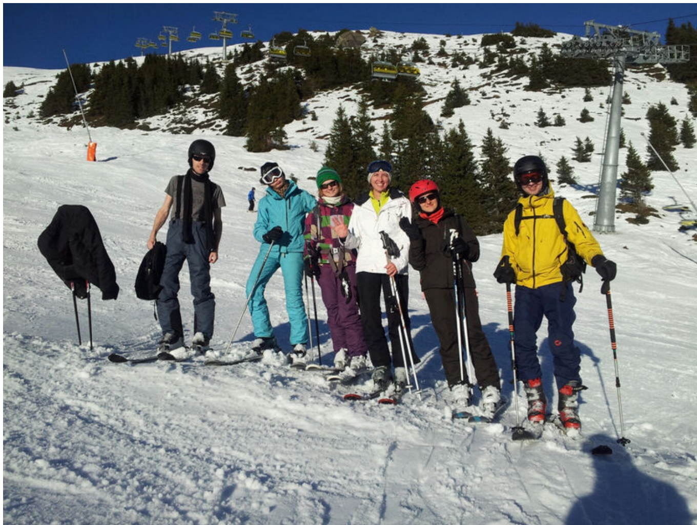
На лыжах с друзьями в Гриндельвальде

Константин Новоселов, лауреат Нобелевской премии по физике, работающий в Великобритании, сказал в интервью «Нашей Газете.ch», что для ученого не должно существовать никаких границ - он должен иметь возможность работать над темой, которая ему действительно интересна. Согласны ли Вы с этим утверждением?