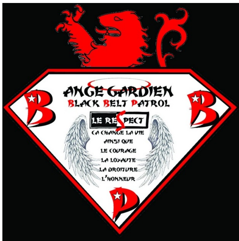
Эмблема патруля