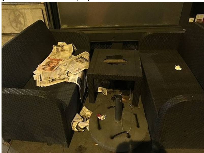
В ночной Женеве не все спокойно