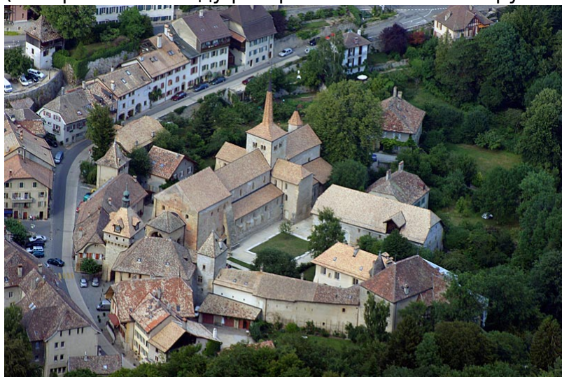
Аббатство в Роменмотье

В 573 году епископом Аванша избран Мариус – он возглавлял Церковь Гельветов вплоть до своей смерти 31 декабря 593 года. Это был типичный представитель тогдашнего духовенства: выходец из семьи богатых землевладельцев из бургундского города Отен (территория современной Франции), он сам владел землями во многих городах Галлии. Поддерживал тесные связи с аристократией и высшим духовенством того времени. По-видимому, именно Мариус перенес около 585 года епископскую резиденцию из Аванша на юг – к Леману, в солнечную Лозанну. Возможно, на его решение повлияла угроза со стороны вторжения алеманнов (которые в 610 году разграбили селения вокруг Аванша).