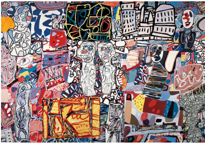
«Пестрые моменты», 1976

Это первая большая ретроспектива Дюбюффе, которую устраивает Фонд Бейлера в XXI веке. Экспозиция проводится при поддержке крупных иностранных музеев (Нью-Йорка, Вашингтона, Парижа, Стокгольма) и частных коллекционеров.