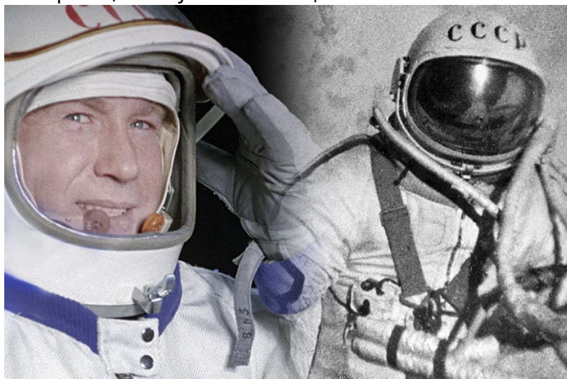
Первый космический «пешеход» Алексей Леонов

Хотя Базз Олдрин и «украл» вместе с Нилом Армстронгом у Алексея Леонова шанс оказаться первым на Луне (Леонов был главным из двух кандидатов в СССР для полета на естественный спутник Земли, но после прорыва американцев лунно-посадочную программу в СССР отменили), зато Леонов стал первым человеком, вышедшим в открытый космос, и за успешное выполнение задания и проявленное мужество и героизм получил звание Героя Советского Союза. В этом году весь мир отмечал 50-летие первой прогулки человека в открытом космосе. О том, насколько нужно было владеть собой, чтобы благополучно вернуться в космический корабль, судите сами: видя, что раздувшийся скафандр мешает залезть в люк, чувствуя покалывание в руках и ногах и рискуя потерять сознание, подполковник стравил лишнее давление из скафандра и после этого залез в люк головой вперед, а не ногами, как того требовала инструкция. Сегодня Алексей Леонов, которому исполнился 81 год, нарасхват – он частый гость международных конференций, дает интервью, выступает с лекциями.