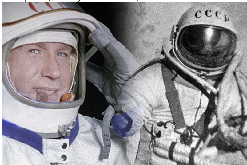
Первый космический «пешеход» Алексей Леонов

Хотя Базз Олдрин и «украл» вместе с Нилом Армстронгом у Алексея Леонова шанс оказаться первым на Луне (Леонов был главным из двух кандидатов в СССР для полета на естественный спутник Земли, но после прорыва американцев лунно-посадочную программу в СССР отменили), зато Леонов стал первым человеком, вышедшим в открытый космос, и за успешное выполнение задания и проявленное мужество и героизм получил звание Героя Советского Союза. В этом году весь мир отмечал 50-летие первой прогулки человека в открытом космосе. О том, насколько нужно было владеть собой, чтобы благополучно вернуться в космический корабль, судите сами: видя, что раздувшийся скафандр мешает залезть в люк, чувствуя покалывание в руках и ногах и рискуя потерять сознание, подполковник стравил лишнее давление из скафандра и после этого залез в люк головой вперед, а не ногами, как того требовала инструкция. Сегодня Алексей Леонов, которому исполнился 81 год, нарасхват – он частый гость международных конференций, дает интервью, выступает с лекциями.