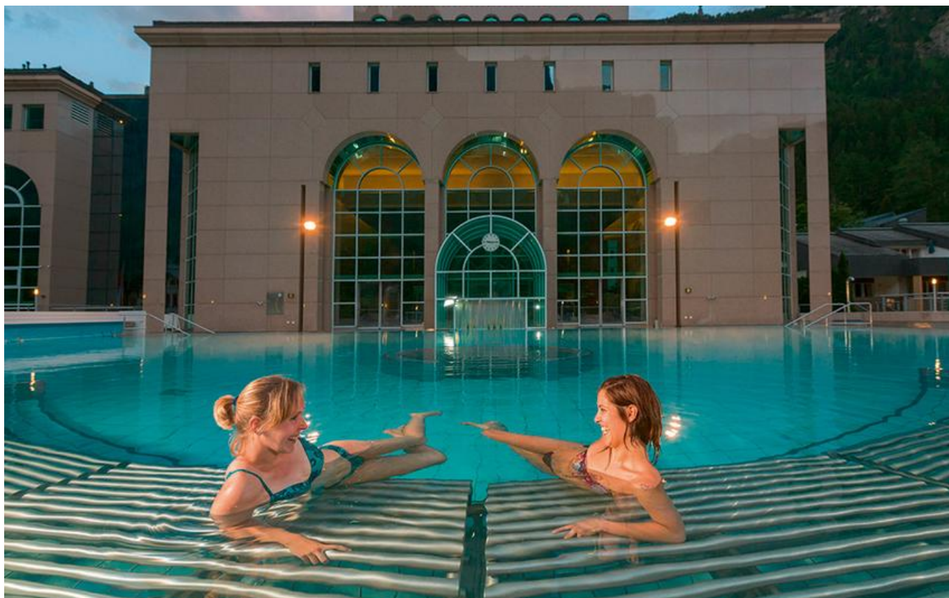
Альпы, горячие источники, отличное настроение...