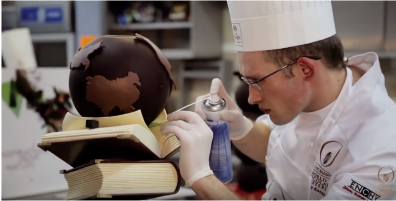
Отборочный тур в России