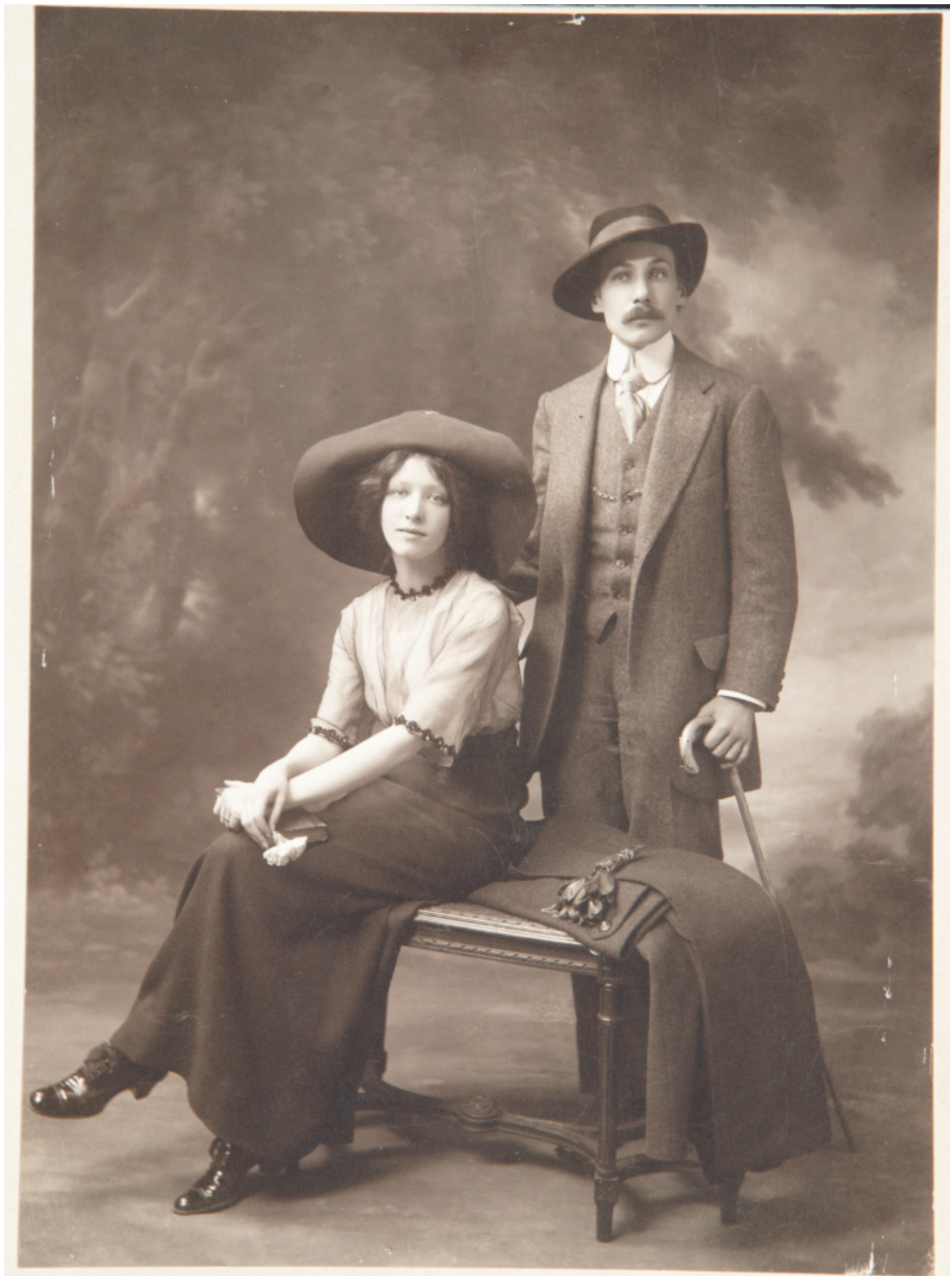
Фотография Белого и Аси Тургеневой в Брюсселе в 1912 году

Центром юбилейных мероприятий стал Государственный музей А.С. Пушкина - здесь до 16 ноября работает масштабная, уникальная по количеству впервые