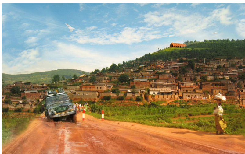
С дорогами в Африке нелегко...

Сегодня дроны в разных странах мира не только помогают военным, кинематографистам и туристам-экстремалам, но и используются в более практических целях: например, для перевозки товаров первой необходимости в горные регионы, доставки почтовых посылок , наблюдения за сельскохозяйственными угодьями .