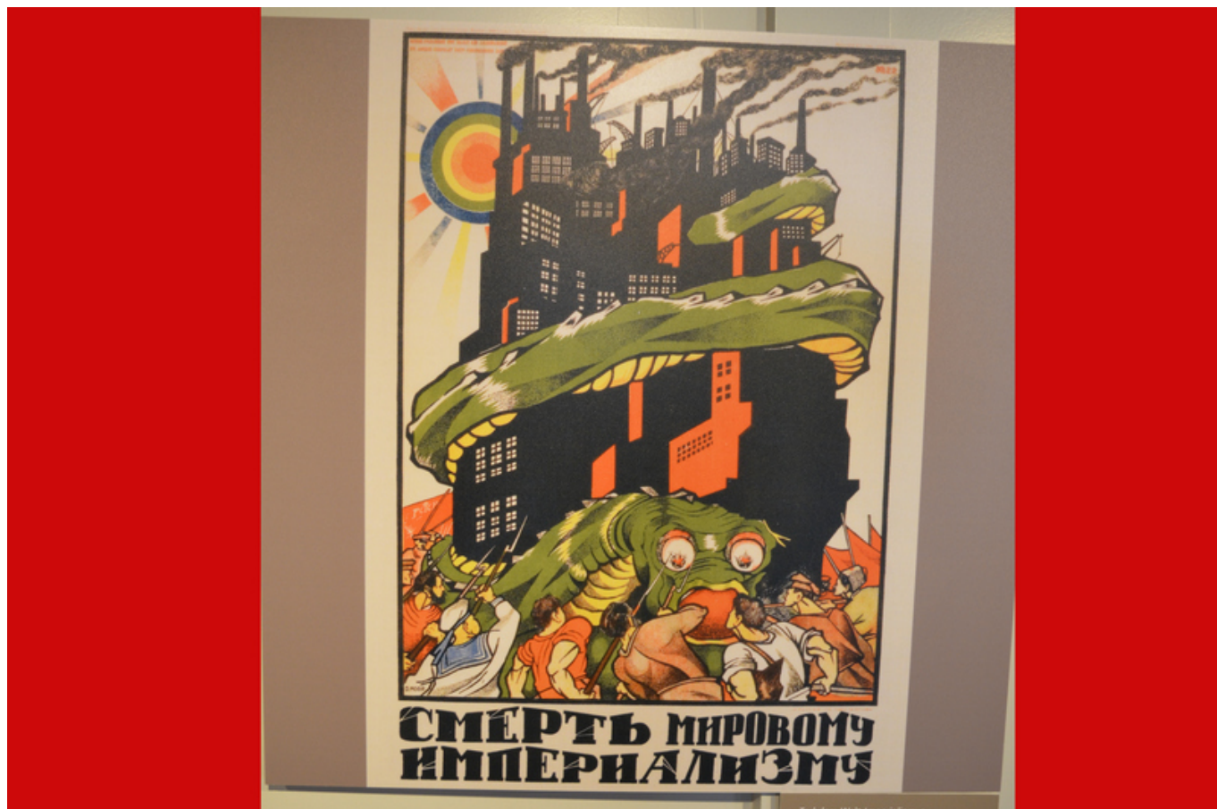
Шварценбург, экспозиция

В Берне в это время находился Владимир Ульянов-Ленин и другие представители русской социал-демократии. Здесь сформировалась основная стратегическая антивоенная линия большевиков: грабительская, несправедливая война развязана монополиями воюющих стран и не нужна рабочим. Отсюда лозунг: все пролетарии – за поражение своих правительств в империалистической войне, за «перерастание войны империалистической в гражданскую».