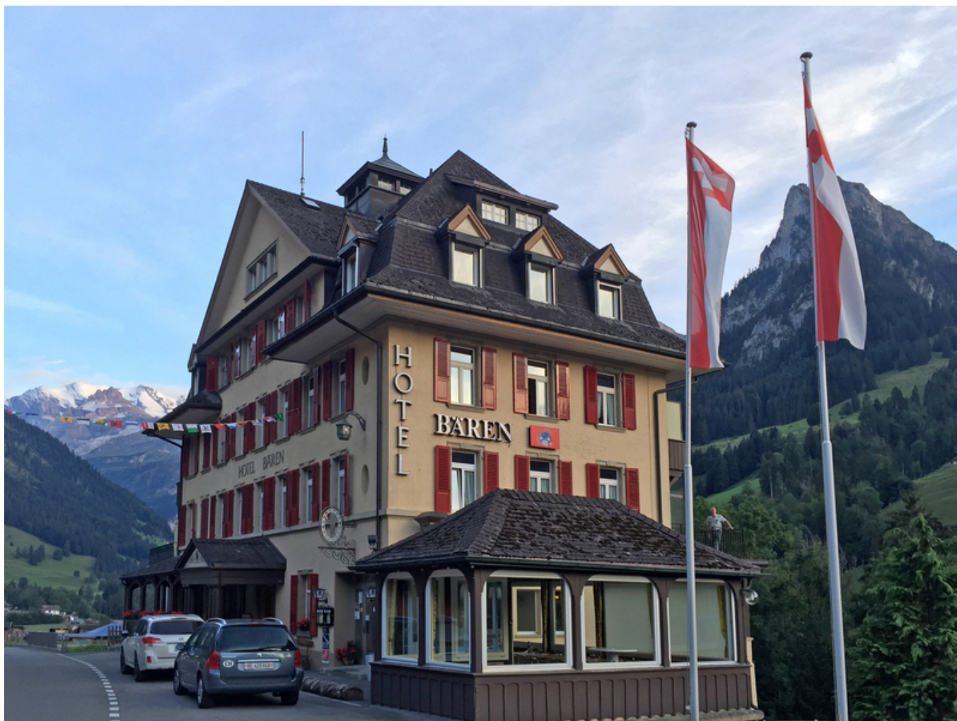
Кинталь Бэрен

Обнародование манифеста произвело сильное впечатление на рабочих. Конференция постановила создать временную международную социалистическую комиссию и назначила Берн местом ее пребывания. Членами комиссии были избраны депутат итальянского парламента Маргари, депутаты Швейцарского национального совета Шарль Нэн и Роберт Гримм, а также Анжелика Балабанова. В Берне был создан временный секретариат.