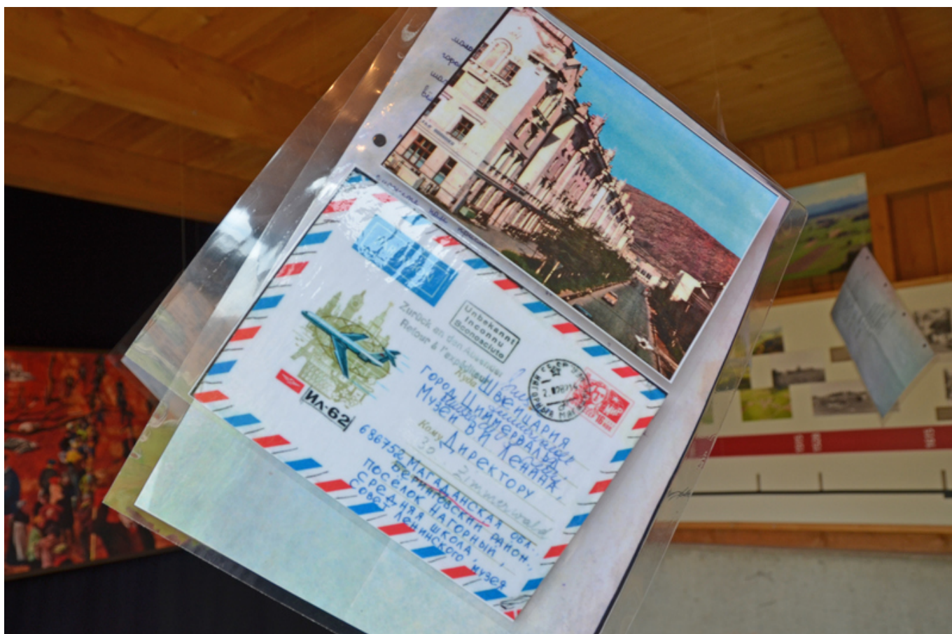
Письма пионеров

С другой стороны, интересна разница восприятия происходящего местным населением тогда и сейчас. В сентябре 1915-го циммервальдцы даже не догадывались, что под прикрытием орнитологического общества у них под носом проводили заседания не ученые, а революционеры! Сегодня в Циммервальде уже не найти пансиона, где ночевали и заседали делегаты сто лет назад, а в годы холодной войны коммуна часто получала письма «из социалистического лагеря» со словами благодарности за организацию коммунистической конференции и с просьбами сообщить что-нибудь о ней и об участии в ней Ленина.