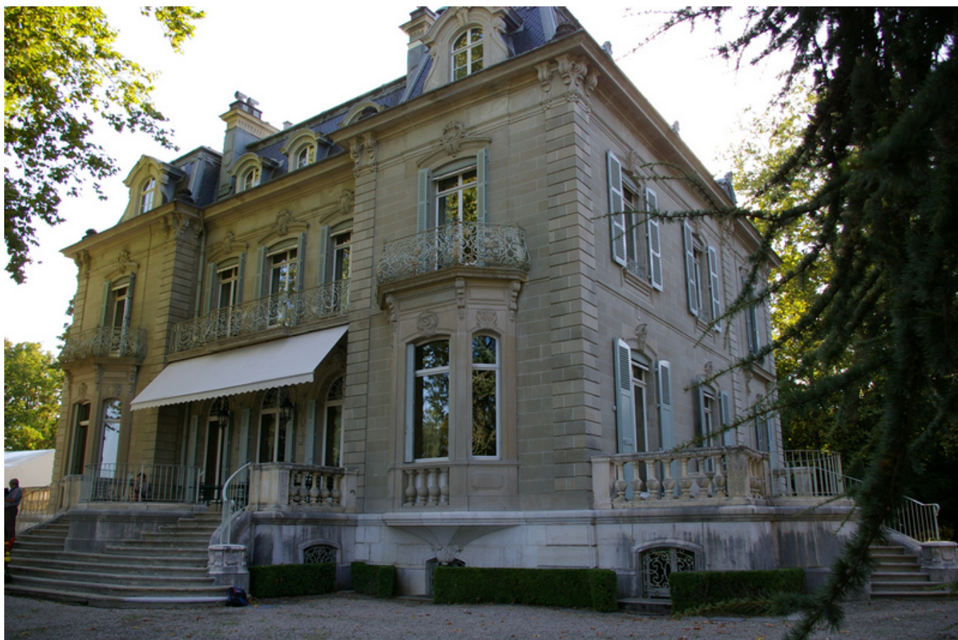
Вилла Fleur d'Eau