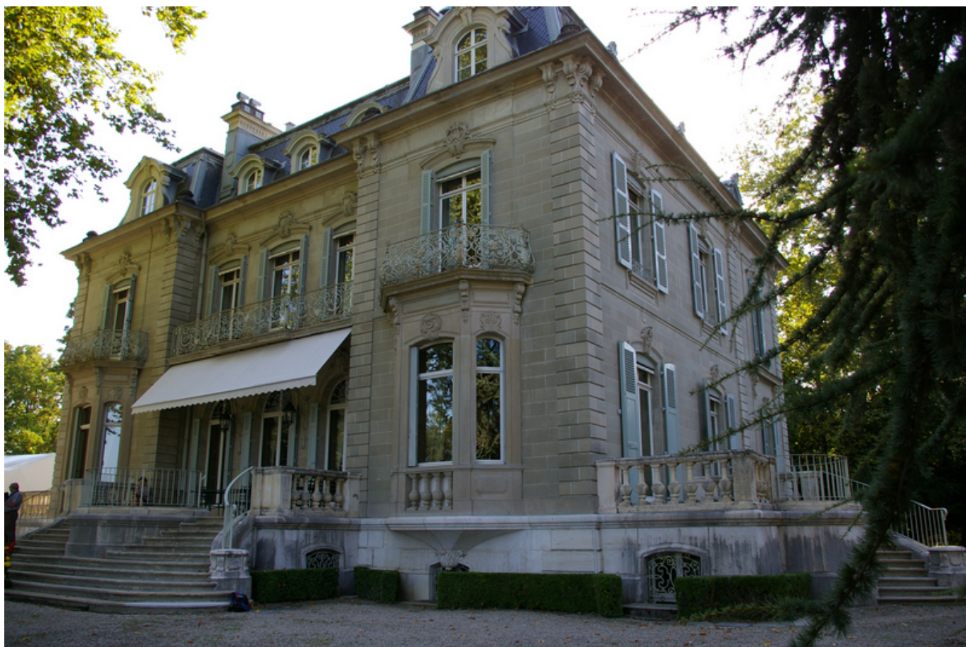
Вилла Fleur d'Eau