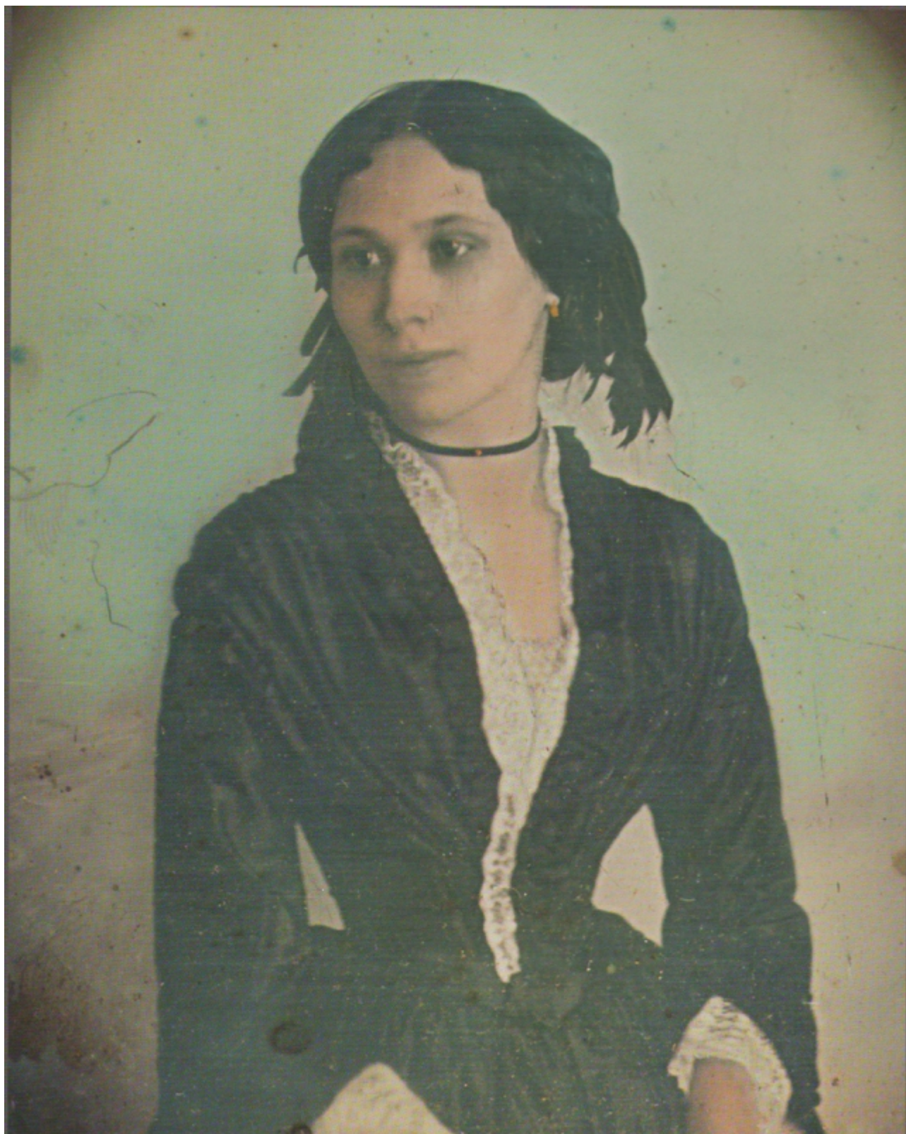
Дагерротип Елены Денисьевой 1850-х годов