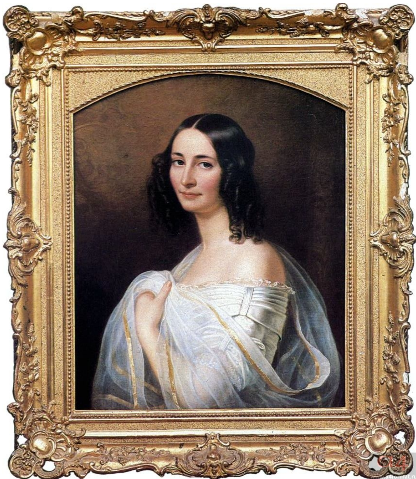
Портрет Эрнестины Тютчевой 1840-х годов

История получила огласку. Тютчев, находившийся в Мюнхене на дипломатической службе, был переведен на работу в Сардинское королевство. Влюбленные виделись урывками. Так, в марте 1838 года им удалось встретиться в Женеве, где они провели вместе более месяца. Они полагали, что это их последняя встреча. Тютчев написал стихотворение, в котором прощался с возлюбленной. Но, как говорится, судьба распорядилась иначе. В 1838 году его жена с детьми направлялась к нему в Турин. Неожиданно на корабле «Николай I» вспыхнул пожар. Всем удалось спастись, но перенесенное потрясение резко подорвало и без того не слишком крепкое здоровье