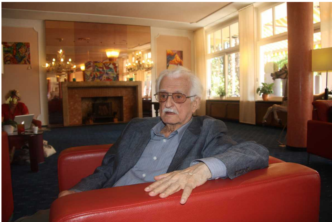
Марлен Хуциев

Наша Газета.ch: Марлен Мартынович, расскажите, пожалуйста, об истории Ваших отношений с фестивалем в Локарно.